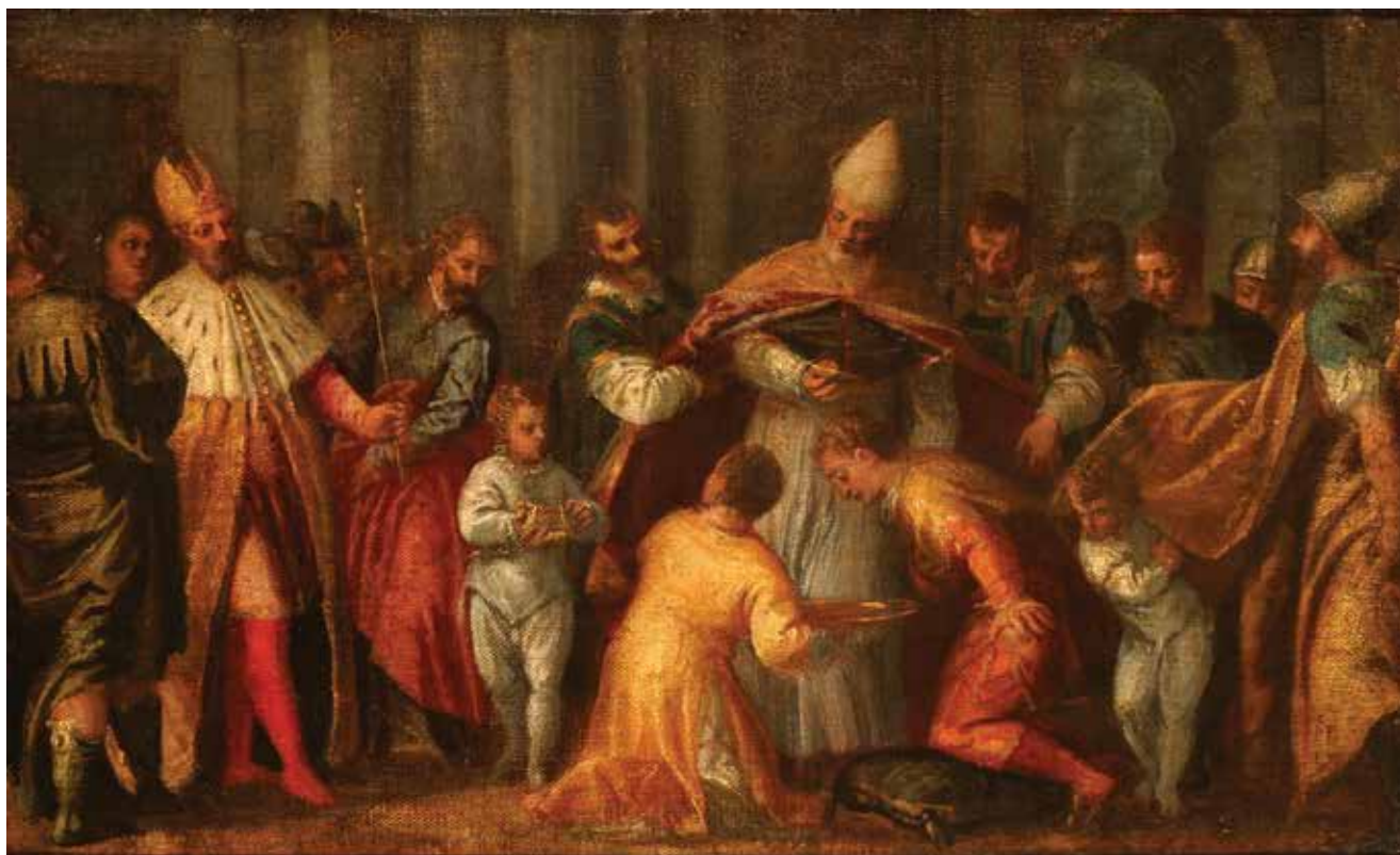
1. Venecijanski slikar, Krštenje vladara , ulje na platnu, 51,6 × 84,3 cm, Strossmayerova galerija starih majstora HAZU, inv. br. SG-376 Venetian painter, Baptism of a Ruler, oil on canvas, 51.6 × 84.3 cm, Strossmayer Gallery of Old Masters at the Croatian Academy of Sciences and Arts, inv. no. SG-376

ske arhivske dokumentacije i dokumentacije Komisije za sakupljanje i očuvanje kulturnih spomenika i starina rezultirala su tumačenjem administrativne oznake KOMZA 568/47. 6 Riječ je o primopredajnom spisu s popisom KOMZA-inih umjetnina koje su 18. prosinca 1947. godine predane Modernoj galeriji. Taj dokument zasad nije pronađen, te nam saznanja o umjetninama predanima Modernoj galeriji kao i podatci o njihovoj provenijenciji ostaju nepoznati.