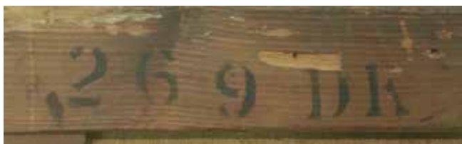
4. Poledina slike, detalj okvira Back of the painting, detail of the frame