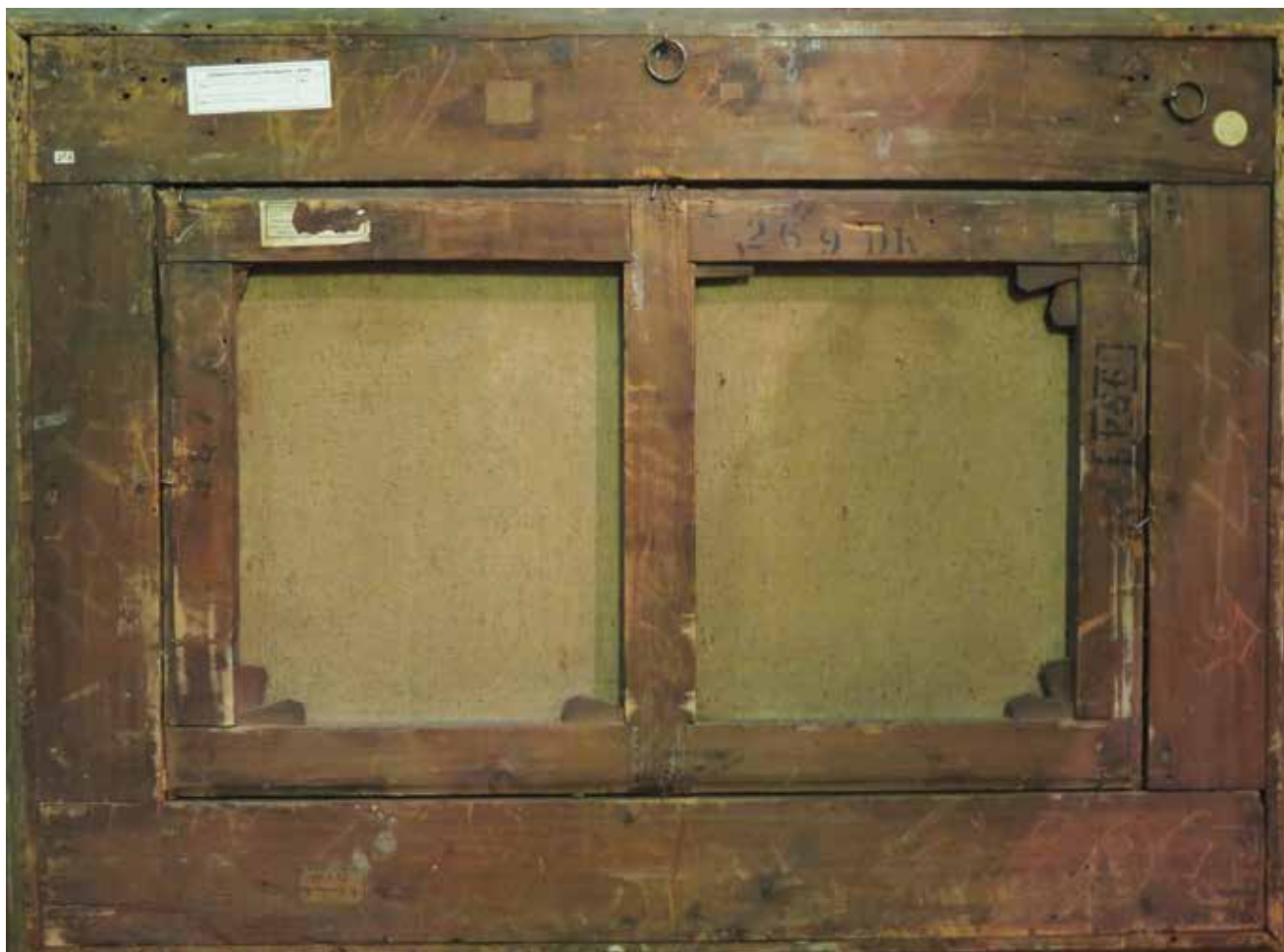
3. Poledina slike The back of the painting

Grahama (1817. – 1885.), jednog od značajnijih skupljača i pokrovitelja umjetnika viktorskih doba u Londonu. 40 William Graham svojom je potporom odigrao odlučujuću ulogu u umjetničkom razvoju Dantea Gabriela Rossettija i Edwarda Burnea-Jonesa. Osim suvremenih umjetnika, skupljao je i djela starih majstora, ostavši zapamćen ponajviše kao istaknuti skupljač ranotalijanskog slikarstva. Na poledini slike Krštenje vladara sačuvane su dvije njegove ceduljice s natpisom »W. Graham Esq. / 281« (sl. 6), kao i broj 457, pod kojim sliku prepoznajemo u Christie'sovu katalogu iz 1886.: »Veronese, 457 Phocas' Baptism«. 41