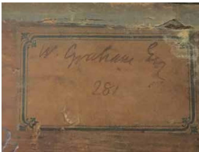
6. Poledina slike, detalj okvira Back of the painting, detail of the frame