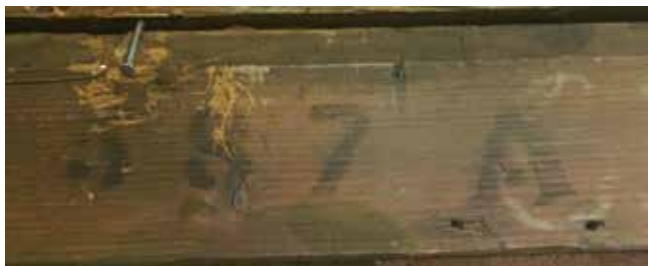
5. Poledina slike, detalj okvira Back of the painting, detail of the frame