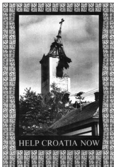
Sarvaš: crkvu Rođenja sv. Ivana Krstitelja u kolovožu 1991. razorile su srpske snage i JNA.

Ekspresivnost poruke na plakatima iz toga ciklusa postignuta je ukomponiranim fotografijama prizora ratom porušenih i teško oštećenih kuća, crkava i drugih spomenika kulture. Želeći što uvjerljivije prikazati tragične posljedice rata, na plakatima se kao osnovni vizualni element pojavljuju ratne fotografije, koje su svojim jasnim, aktualnim i sugestivnim porukama jačale moral te su bile usredotočene na zaustavljanje rata i promicanje prava Hrvatske na slobodu i neovisnost. Hrvatskim ratnim plakatima ovjekovječena su stradanja hrvatskog naroda i posljedice velikosrpske agresije (stradanja ljudi, uništavanje prirodne i kulturne baštine u Hrvatskoj).