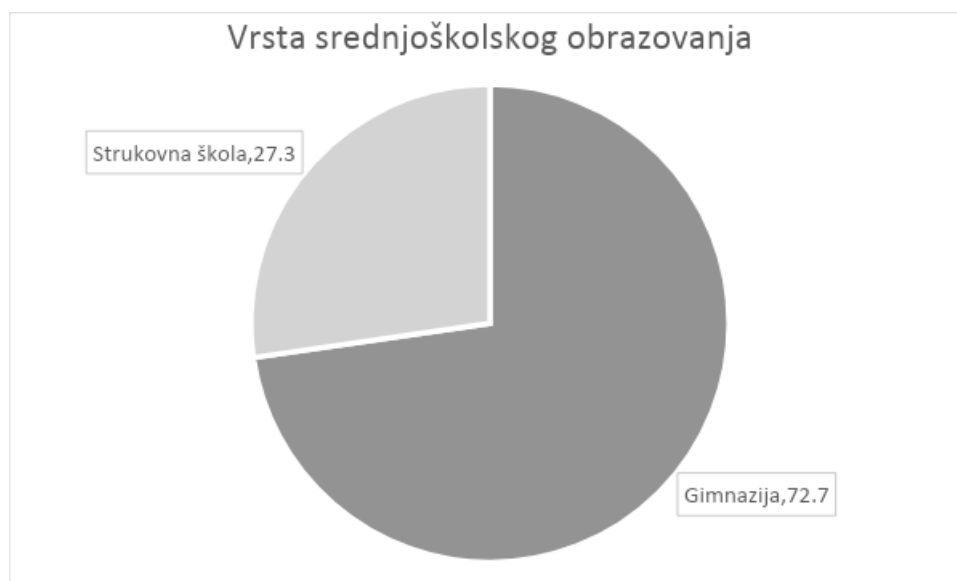
Slika 1. Grafički prikaz strukture ispitanika prema vrsti srednjoškolskog obrazovanja

U Tablici 1. prikazani su rezultati učestalosti korištenja dostupnih knjižnica. Radi se o trećem pitanju anketnog upitnika koje se odnosilo na utvrđivanje obrasca ponašanja ispitanika, odnosno na procjenu učestalosti korištenja različitih vrsta knjižnica prije upisa na Fakultet. Iz Tablice 1. vidljivo je da osnovnoškolsku knjižnicu niti jednom nije posjetilo 6 ispitanika (8.1%), 1-10 puta je posjetilo 20 ispitanika (27.0%), 11-20 puta je posjetilo 29 ispitanika (39.2%), 21-30 puta je posjetilo 14 ispitanika (18.9%), a više od 31 puta osnovnoškolsku knjižnicu posjetilo je 5 ispitanika (6.8%). Srednjoškolsku knjižnicu niti jednom nije posjetilo 4 ispitanika (5.4%), 1-10 puta je posjetilo 22 ispitanika (29.7%), 11-20 puta je posjetilo 27 ispitanika (36.5%), 21-30 puta je posjetilo 14 ispitanika (18.9%), a više od 31 puta srednjoškolsku knjižnicu posjetilo je 7 ispitanika (9.5%). Gradsku knjižnicu niti jednom nije posjetilo 15 ispitanika (19.5%), 1-10 puta je posjetilo 27 ispitanika (35.1%), 11-20 puta je posjetilo 15 ispitanika (19.5%), 21-30 puta je posjetilo 9 ispitanika (11.7%), a više od 31 puta gradsku knjižnicu posjetilo je 11 ispitanika (14.3%). Fakultetsku knjižnicu niti jednom nije posjetilo 46 ispitanika (73.0%), 1-10 puta je posjetilo 10 ispitanika (15.9%), 11-20 puta je posjetio 1 ispitanik (1.6%), 21-30 puta je posjetilo 3 ispitanika (4.8%), a više od 31 puta fakultetsku knjižnicu posjetilo je 3 ispitanika (14.8%). (Tablica 1.)