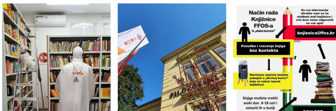
Slika 1. Kratki prikaz prema ograničenom sustavu rada Knjižnice FFOS-a

Knjižnica Filozofskoga fakulteta u Osijeku tijekom pandemije koja je zahvatila cijeli svijet, zadržala je svoje korisnike i usprkos tome što korisnici nisu bili fizički prisutni, komunikacija s knjižnicom se neprestano odvijala. Online uloga Knjižnice nije novost, ona svojim uslugama pomaže u edukaciji samostalnog pretraživanja informacija dostupnim na mrežnim izvorima i zauzima važnu ulogu pri odabiru i filtriranju relevantnih i valjanih informacija u digitalnom svijetu. Knjižnice diljem svijeta počele su se susretati s velikim izazovima, ali zapravo su samo dokazale da normalno funkcioniraju i u kriznim situacijama jer su upravo one glavno središte za informiranje svojih korisnika. Knjižnica Filozofskoga fakulteta je od samoga početka omogućila svojim korisnicima posudbu bez kontakta. Uvela je korisnike u korištenje knjižničnih usluga bez kontakta.