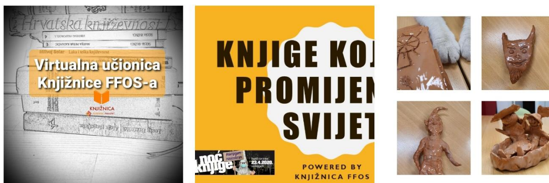
Slika 2. Prikaz virtualnih izložbi

Nova lokacija na kojoj je Knjižnica smještena od lipnja 2019. godine studentima je u načinu rada zapravo prednost jer knjigu mogu preuzeti na otvorenom, i to vrlo brzo bez kontakta.. Knjižnični se život i dalje aktivno odvijao – interaktivnim izložbama kroz suradnju s nastavnicima pojedinih kolegija, pa je tako krajem ožujka predstavljena i prva u nizu virtualnih izložbi. Komunikacija između metodike književnosti i likovne umjetnosti prikazana je studentska izložba Književna keramika u Knjižnici, nastala na temelju Povjestica Augusta Šenoje i bajke Ivane Brlić Mažuranić, pod mentorstvom izv. prof. dr. sc. Jakova Sabljica i učiteljice Mirne Lišnjić, a u virtualni svijet prenesena fotografijom voditeljice knjižnice Lane Šuster.