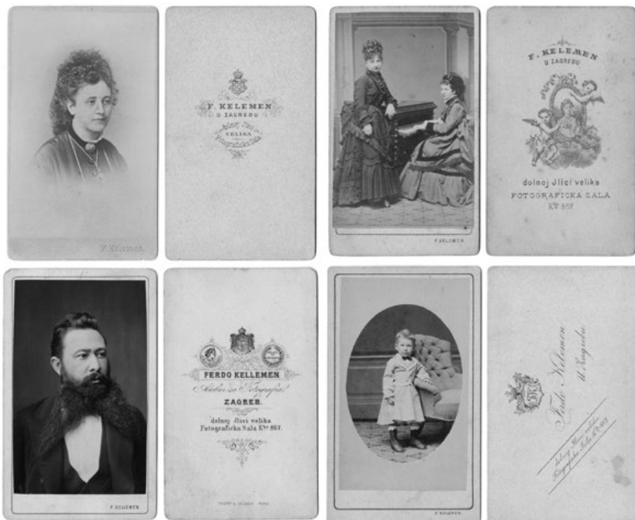
Slika 7. Primjer fotografija i poledina dekorativnih kartona iz desetljeća Kelemenova vlasništva (HR-HDA-2018, Zbirka fotografija iz hrvatskih fotografskih ateljea 19. i 20. stoljeća).

Godine 1873. istekao je rok od deset godina na koji je prije gradnje izdana dozvola za korištenje ateljea. Objekt po svemu sudeći nije srušen, jer o tome u izvorima nema podataka, a iz sačuvanih fotografija vidimo da i dalje radi, kao i to da je dio studijskih rekvizita kroz cijelo vrijeme ostao nepromijenjen. To nam svakako govori u prilog kontinuitetu fotografiranja u istom prostoru.