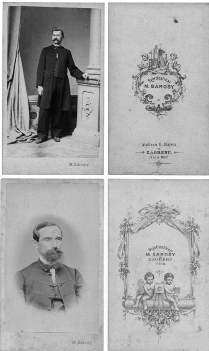
Slika 5. Primjeri fotografija i poledina dekorativnih kartona iz vremena Sárosyjeva upraviteljstva Majerovim ateljeom (HR-HDA-2018, Zbirka fotografija iz hrvatskih fotografskih ateljea 19. i 20. stoljeća)

izvedba, a solidnu kvalitetu samih fotografija prate odmjerene i ukusno izvedene vjnjete na poledini dekorativnih kartona s tipografijom „svjetloslikar M. Sárosy ateliera G. Mayera u Zagrebu, Ilica 867“ ili pak samo kao „svjetloslikar M. Šarošy u Zagrebu, Ilica“ (v. sliku 5).