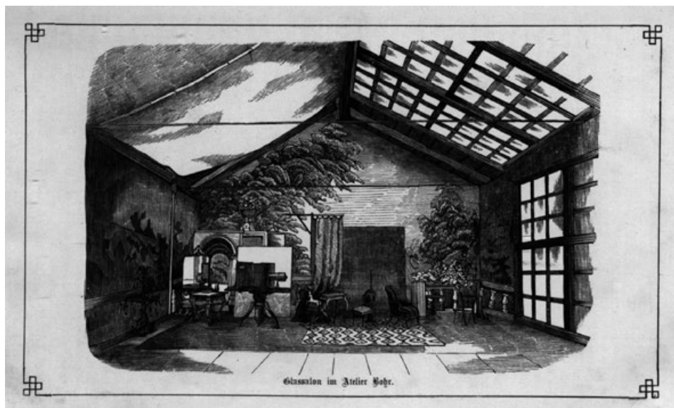
Slika 2. Studijska oprema u glassalonu bečkoga fotografa Rudolfa von Bohra ( Photographische Correspondenz , 1864, s. p). Za pretpostaviti je da se interijer Majerove sale nije bitno razlikovao.

Pod Veneševim je upraviteljstvom Majerova zagrebačka podružnica dočekala i 1864. godinu, koju je u čitavoj Hrvatskoj obilježilo održavanje Prve dalmatinsko-slavonsko-hrvatske izložbe plodinah, tvorinah i umjetninah . Za nju je već u veljači Veneš prijavio vlastite „slike i svietlopise“, 20 a – sudeći prema katalogu izložbe – navedeni su radovi uistinu bili izloženi unutar dva podrazreda. Tako ga u XXVIII. podrazredu nalazimo pod rednim brojem „3438. Venesz Josip, u Zagreba, u Majerovom (svietlo- pis. zavodu), i svietlopise“ te u XXXI. podrazredu pod brojem „3662. Venesz Jos., iz Zagreba, slike smastima“. 21