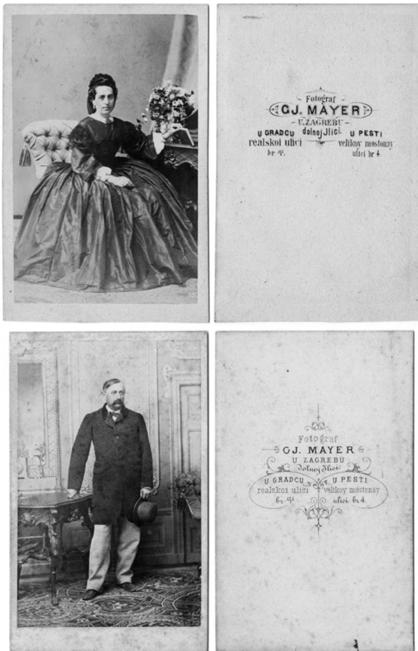
Slika 3. Primjeri fotografije i poledina dekorativnih kartona iz vremena Veneševa upraviteljstva Majerovim ateljeom. Na fotografijama vidimo dio inventara koji se pojavljuje i na snimkama iz vremena kasnijih upravitelja i zakupnika (HR-HDA-2018, Zbirka fotografija iz hrvatskih fotografskih ateljea 19. i 20. stoljeća).