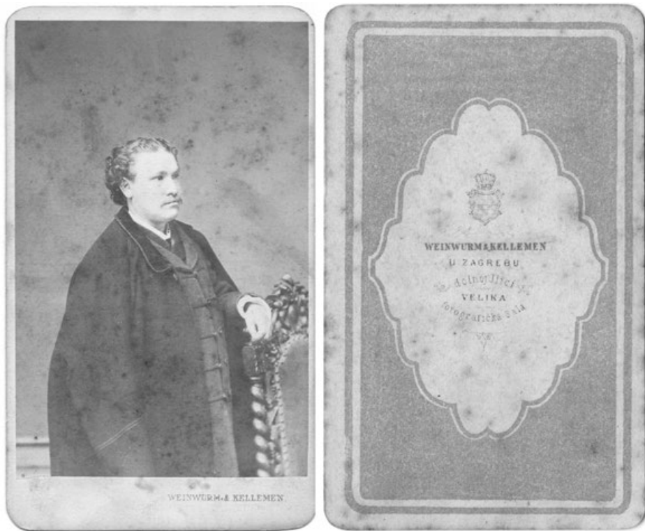
Slika 6. Primjer fotografije i poledine dekorativnog kartona iz vremena zakupnika Weinwurma i Kelemena

objavljeni oglas na njemačkom jeziku znatno je kraći i s manje detalja, ali iz njega doznajemo da je atelje imao grijanje i da je cijena tuceta fotografija i dalje iznosila tri forinte. 47