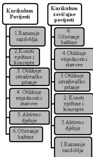
Slika 1. Usporedba, rangiranje i kompatibilnost ciljeva kurikuluma Povijesti i kurikuluma iz zavičajne povijesti

Usporedba, rangiranje i kompatibilnost ciljeva Kurikuluma Povijesti i kurikuluma iz zavičajne povijesti u ovom radu prikazane su grafikonom. Osnovni ciljevi Kurikuluma Povijesti označeni su brojevima i rangirani prema važnosti u usporedbi s osnovnim ciljevima kurikuluma zavičajne povijesti.