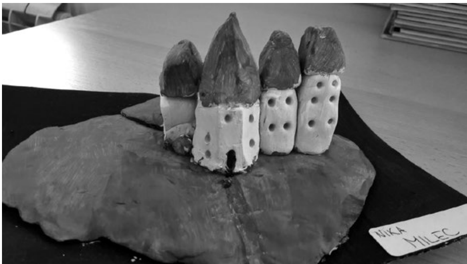
Slika 3. Maketa Starog grada na satu Likovne kulture