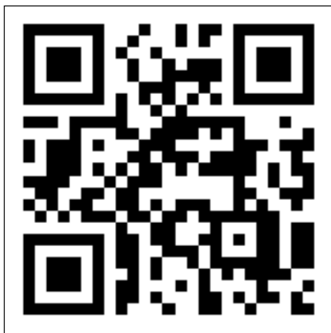
Slika 4. QR kod za radionicu

Radionica 2. Interaktivna radionica u kojoj učenici uz pomoć pametnih telefona analiziraju slikovne povijesne izvore, provjeravaju novostečena znanja i pišu svoje dojmove koristeći se pritom QR kodovima (Slika 4.) te digitalnim alatima Padlet i Linoit .