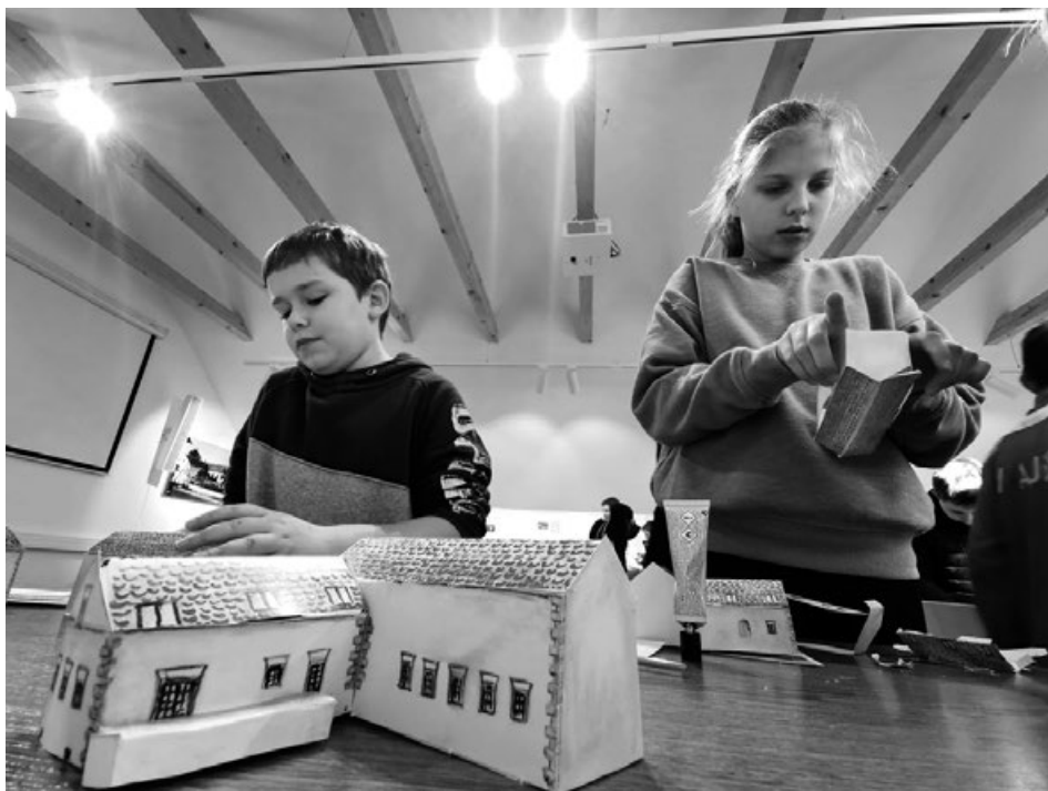
Slika 9. Radionica izrade makete Stare škole, danas zgrade Muzeja planinarstva Ivanec

Vežano uz izložbu „Od Stare škole do suvremenog muzeja“ izrađen je nacrt za izradu makete Stare škole, odnosno zgrade današnjeg Muzeja (Slika 9.). Radionica je odlično prihvaćena od učenika te se javlja potreba izrade novih materijala.