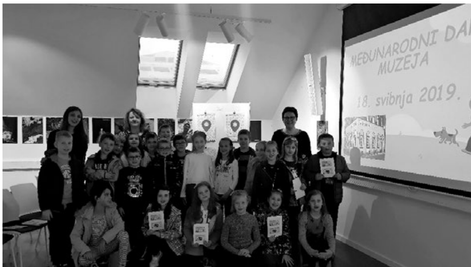
Slika 6. Obilježavanje Međunarodnog dana muzeja