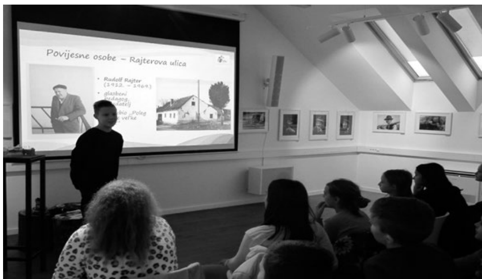
Slika 2. Vršnjačko poučavanje u muzeju