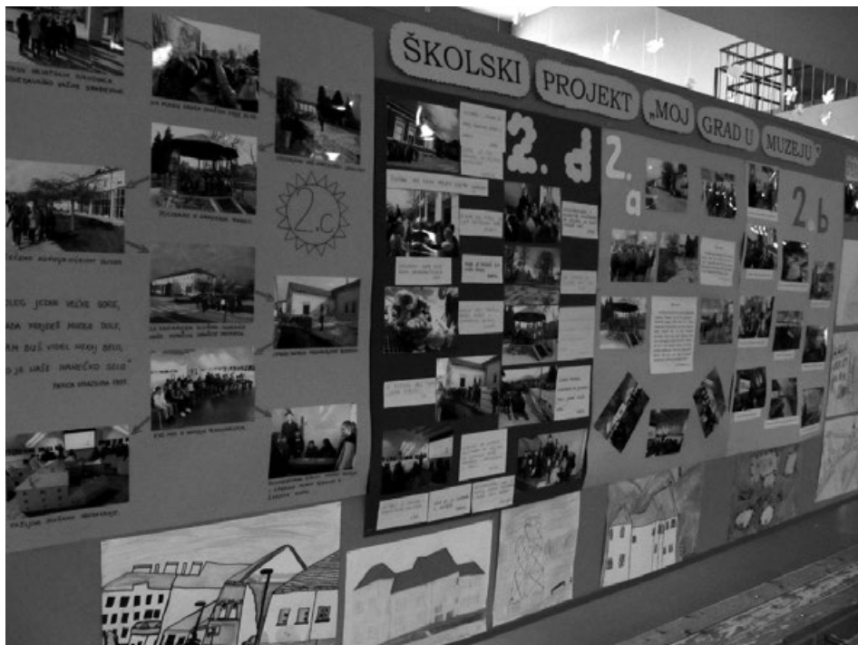
Slika 7. Izložba u školi povodom Međunarodnog dana muzeja

Predstavljanje projekta na Danu škole (kraj svibnja), postavljanje izložbe u predvorju škole povodom Međunarodnog dana muzeja (Slika 7.).