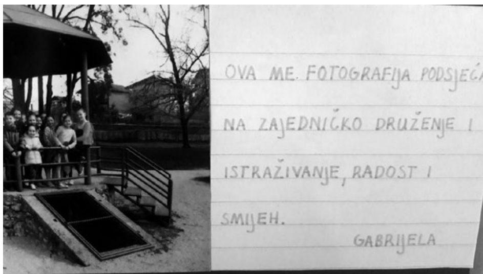
Slika 5. Razredni poster i evaluacija projekta