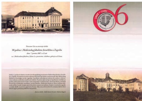
Slika 1. Izgled pozivnice u povodu otvaranja izložbe “90 godina Medicinskog fakulteta”

Uz priču o razvoju Medicinskog fakulteta u Zagrebu, kao i o osnivanju pojedinih medicinskih institucija u Zagrebu i Hrvatskoj, koja teče duž zidova izložbenog prostora započinjući na kraju 19. stoljeća i nastavljajući se do današnjih dana, predmeti u izložbenim vitrinama, dekorativnom ormaru i samostalni eksponati (prvi udžbenici, arhivski dokumenti,