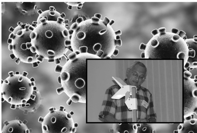
Slika 1. Matematički model širenja koronavirusa, [4].

Nevidljivom, nečujnom, neosjetnom, nemirisnom, golemom se brzinom virus proširio nakon Kine diljem svijeta, a posebice u SAD, Europu, Brazil, Indiju, Rusiju, Afriku i drugdje. Od prvog (“službeno”) zaraženog iz prosinca 2019. do kolovoza 2020. (kad je pisan ovaj tekst), u svijetu je zaraženo (okruglo) više od 25 milijuna ljudi, a od toga je umrlih od te bolesti više od milijun ljudi s naznakom daljeg širenja i pogibije sve dok učinkovito cjepivo ne spriječi taj trend. Svjetska zdravstvena organizacija (WHO) i kod nas Stožer za civilnu zaštitu uz HZJZ (Hrvatski zavod za javno zdravstvo) svakodnevno daju upute za ponašanje građana dok traje pandemija, ali unatoč svemu ona ustraje.