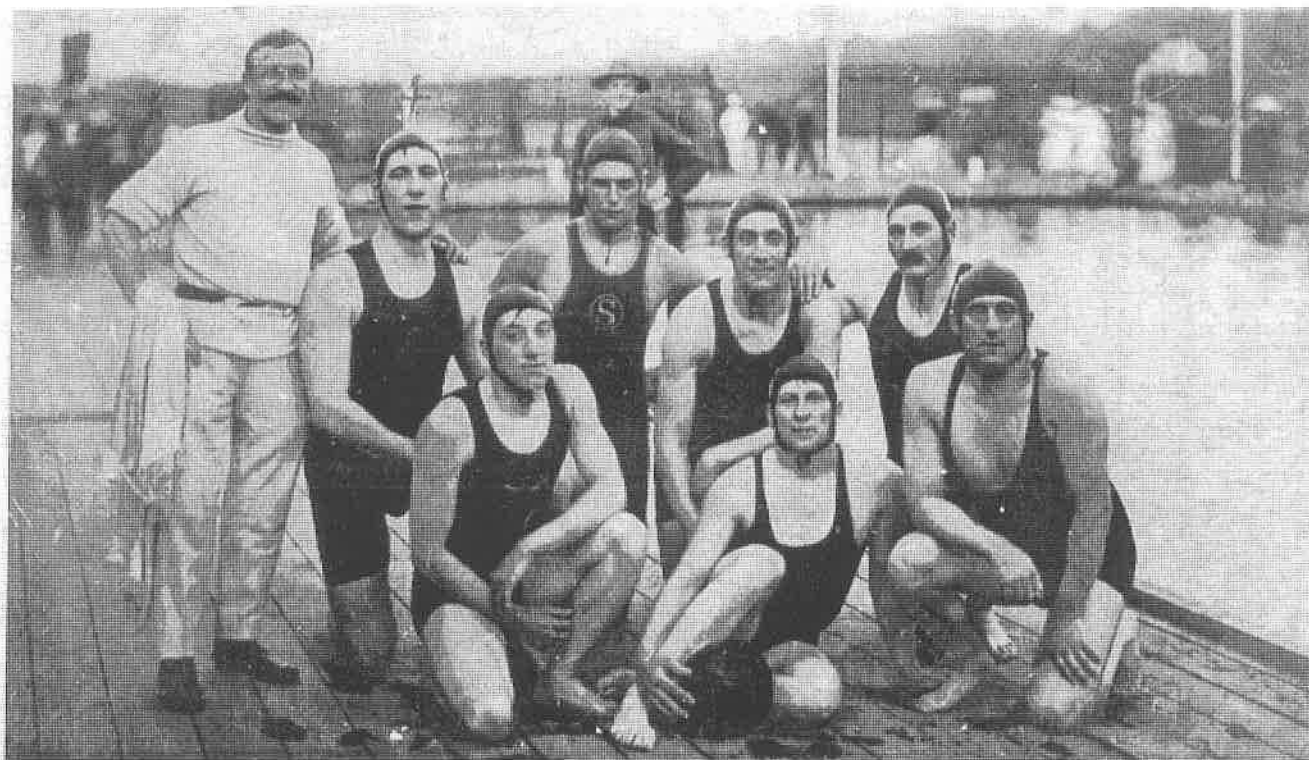
Paolo Radmilović, drugi slijeva, kao član vaterpolo reprezentacije Velike Britanije na Olimpijskim igrama 1908. godine.

bi nam to uspjelo, nastavlja Bučar, čitava mnogobrojna pak internacionalna publika imala bi prilika da upozna Hrvate, za koje još mnogi žalibože ni ne znadu da postoje na kruglji zemaljskoj. Kao iskusan stručnjak Bučar je upozorio da bi rad u tadašnjem Hrvatskom sokolu trebalo podrediti njekim vrstima vježba stavljenih u program Igara u Ateni . Bučar je predložio da se što više vježba na svježem i otvorenom zraku .