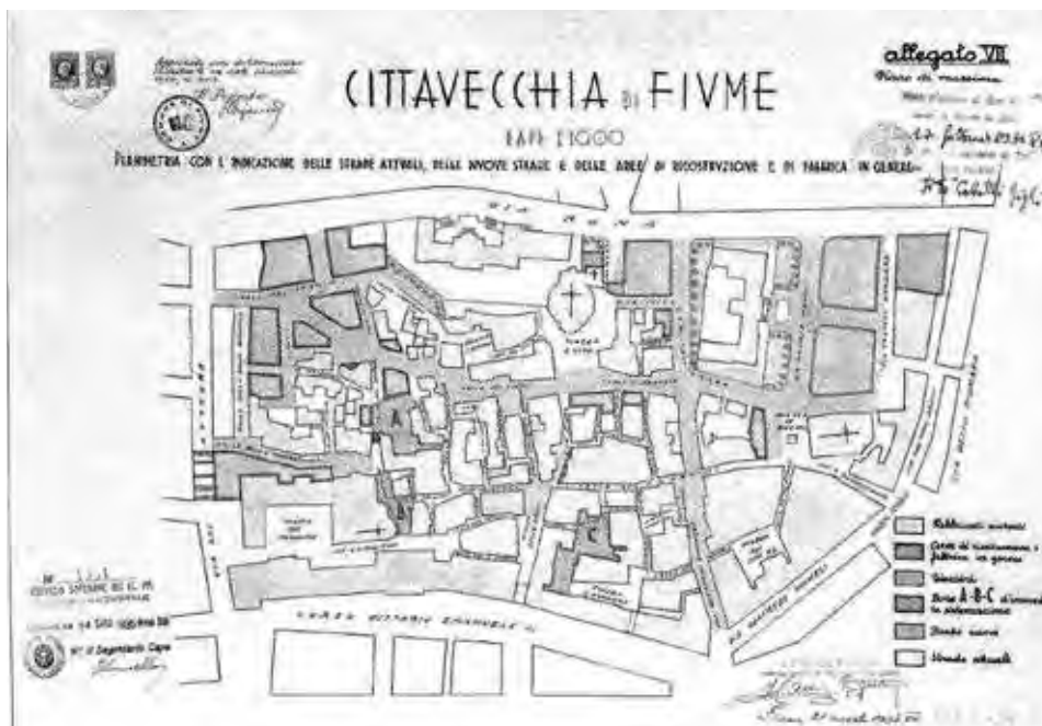
Fiume, Progetto per Cittavecchia, Lotti A, B e C, 1936 (da Prostor , n. 12, 2004, p. 183, Fiume, Istituto per la Conservazione e il Restauro).