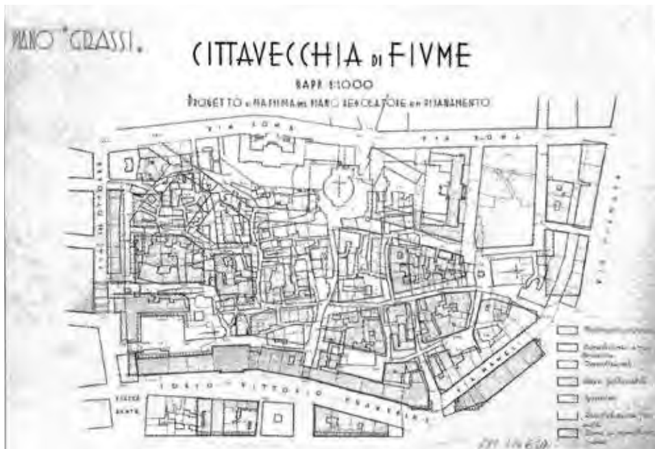
Fiume, Progetto per Cittavecchia, zona centrale presso San Vito (sulla base delle previsioni di Paolo Grassi), 1936

Stato jugoslavo passare praticamente dentro il quartiere di Sussak e dunque con il centro diviso in due parti 8 ; ma anche per le difficoltà che si prospetarono immediatamente nel trovare un equilibrio economico con la vicina Trieste, da sempre 'concorrenziale' soprattutto per le questioni del Porto.