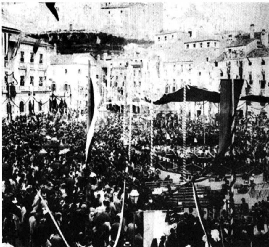
Pirano, inaugurazione del monumento dedicato a Tartini

con una sorta di sciopero generale: botteghe ed officine rimasero chiuse, le strade deserte, le donne vestite a lutto, nastri e drappi neri furono appesi a porte e finestre, mentre pattuglie di gendarmi percorrevano minacciosamente le calli.