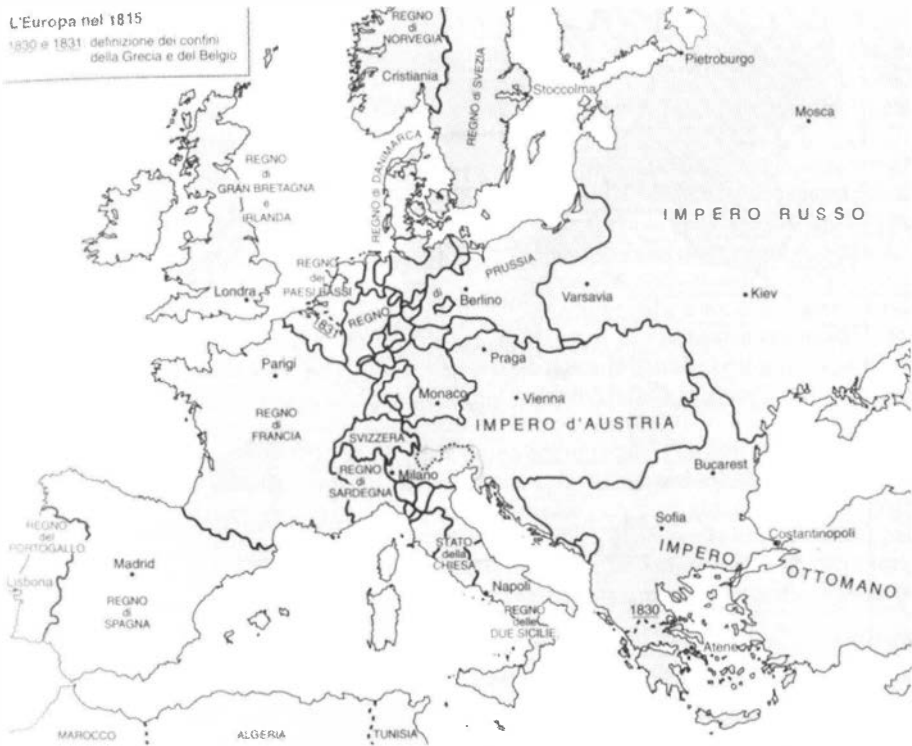
L'Europa nel 1815

Un primo sintomo del nuovo fenomeno furono i moti carbonari che, seppur in maniera marginale, non risparmiarono la nostra regione. Nel 1818 furono processati a Zara i componenti di due gruppi denominati “Guelfi” e “Cinque”, affiliati alla carboneria; nel 1823 le autorità locali denunciarono che le idee carbonare avevano trovato proseliti nella cittadina di Montona ed a Rovigno. Anche questo periodo ha lasciato alla storia istriana un personaggio che avrebbe fatto epoca: il poeta di Isola, Pasquale Besenghi degli Ughi, che si dimostrò persona ribelle e scomoda già nel suo soggiorno triestino, ma toccò l’apice nel 1820, quando, appresa la notizia dell’insurrezione del popolo di Napoli contro i sovrani borbonici, decise di partire per unirsi ai rivoltosi accompagnato da un compagno pordenonese; i due giunsero in Campania quando il moto si era già concluso. Pochi anni dopo l’istriano riprese la sua strada avventurosa all’inseguimento dei suoi ideali, recandosi in Grecia per partecipare alla