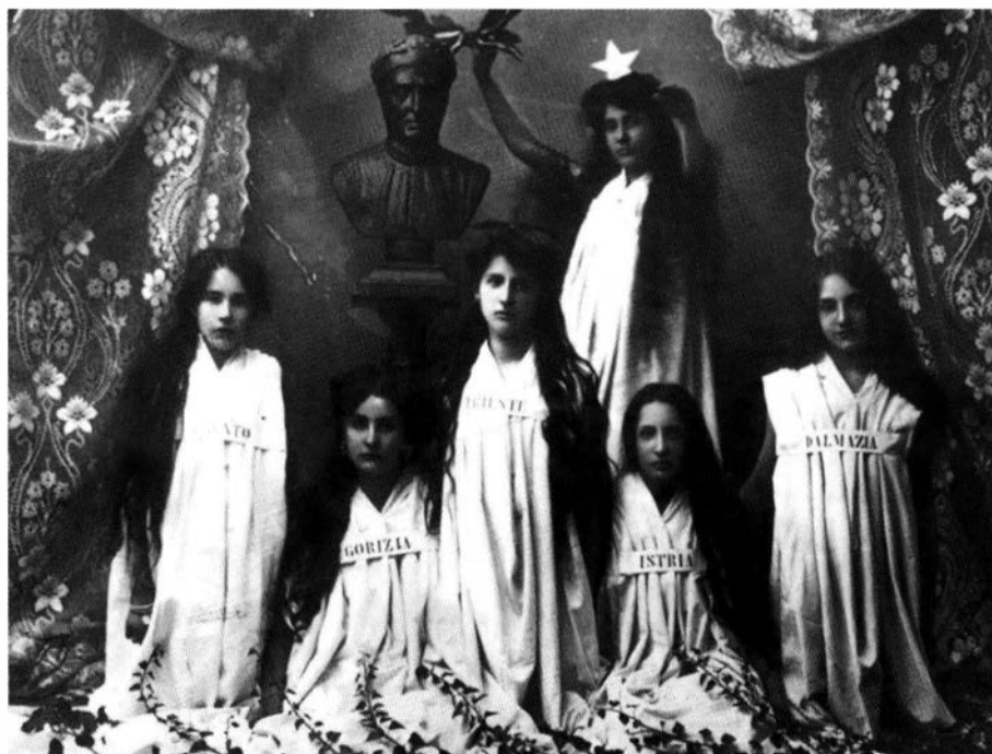
Allegoria che rappresenta la Lega Nazionale con le cinque province italiane dell'Austria (Trentino - Trento, Friuli - Gorizia, Trieste, Istria e Dalmazia)

Indubbiamente la società che più riuscì ad ingrandirsi, a farsi odiare dalle autorità e a svolgere un importante ruolo sociale fu la Lega Nazionale . La sua storia spostò la nostra attenzione sul tema dell'istruzione, che fu forse il più agguerrito teatro di scontro nazionale in Istria. Secondo una severa ma efficace definizione dello studioso austriaco Claus Gatterer, “nella sterile e barbara rissa fra le nazionalità gessetti e lavagne servivano da armi, scuole e asili da fortezze e trincee, maestri e maestre soldati da prima linea” 44 . Italiani, Sloveni e Croati, erano consapevoli che il predominio politico ed economico passava necessariamente attraverso la creazione di una classe dirigente preparata, il che non sarebbe potuto avvenire senza il raggiungimento di un adeguato livello di istruzione.