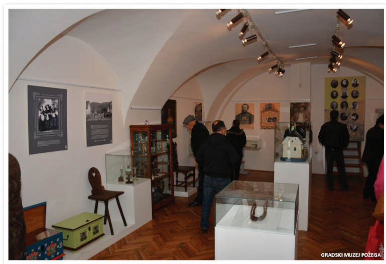
Slika 4. Privremeni postav iz 2014.g., GMP

Etnološkog odjela s Odjelom povijesti umjetnosti prikazana je tematska cjelina svakodnevnog života i stanovanja u selu i gradu s prijelaza iz 19. u 20. stoljeće kroz lik žene i opremanje kuće. Zašto žena? Upravo je žena bila ona koja je vodila brigu o potrebama obitelji i vođenju kućanstva. Izloženi predmeti prikazali su razlike, ali i sličnosti gradskog i seoskog životnog prostora po načinu odijevanja žena, njihovu izgledu i ukrašavanju, kao i uređenju kuće i kućnog inventara u seoskoj i gradskoj kući 10 (slike 4 i 5). U ovoj tematskoj cjelini maketa zadružne kuće dobila je na važnosti jer prezentira seosku arhitekturu i stanovanje te se kao takva u interpretaciji mogla izdvojiti i u zasebnu priču. To se osobito moglo primijeniti u vođenju školskih grupa, koje su po više puta posjećivale muzej. 11