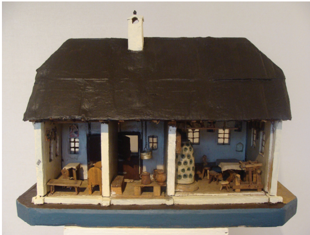
Slika 2. Maketa zadržne kuće 20. st., E 723, GMP

cm. Sastoji se od triju prostorija i trijema te je opremljena kućnim inventarom kakav je, prema Čakalićevu zapisu (Zbirka Ive Čakalića, inv. br. E 679), bio u drugoj polovici 19. stoljeća: veće sobe sa zidanom peći od petnjaka i klupom, stolom s klupama i stolicama, tkalačkim stanom te slikama na zidovima, zatim kuhinje s otvorenim ognjištem, suđem i priborom za kuhanje te zadnje prostorije – sobe s krevetom, klupama i stolom (slika 2).