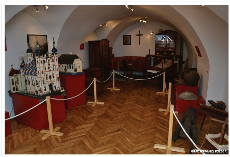
Slika 3. Privremeni postav iz 2006./2009. g., GMP

Gradskog muzeja Požege 2003., 2006. i 2014. godine. 8 Etnografske cjeline u tim postavima bile su orijentirane na prikaze etnografskih značajki požeškoga kraja s naglaskom na tekstilno, lončarsko i drveno rukotvorstvo s elementima gospodarskog prikaza, seoske arhitekture, ali i samog stvaralaštva pučkog umjetnika Ive Čakalića (slika 3). U posljednja dva postava naglasak etnografske prezentacije bio je na