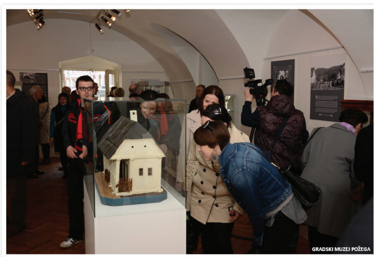
Slika 5. Maketa zadružne kuće u postavu 2014.g., GMP

Višegodišnja komunikacija s posjetiteljima kroz Posljednji privremeni postav? pokazala je višeznačnost interpretacije samog predmeta. Privlačan zbog svog slikovitog izgleda, bio je vrlo pogodan za edukativna vodstva najmlađe generacije – djece. Upravo su ta iskustva naglasila važnost tog muzejskog predmeta kao izvora znanja koje nam daje veliku količinu podataka. Osim što nam prezentira način stanovanja i življenja u tradicijskoj zadružnoj kući druge polovice 19. stoljeća, donosi nam i priču o životu požeškoga seljaka onoga vremena, „od svagdana do blagdana“, kao i o samom etnografu i pučkom stvaraocu Ivi Čakaliću. Iz toga je proizašla zamisao da maketa kuće bude inspiracija za tematsku ideju vodilju budućeg etnografskog dijela postava muzeja. Nastojalo se dakle značajke tradicijske kulture sela Požeštine s kraja 19. i prve polovice 20. stoljeća prikazati u sklopu tradicijske zadružne kuće kao prvog prostornog okvira seljačkoga života.