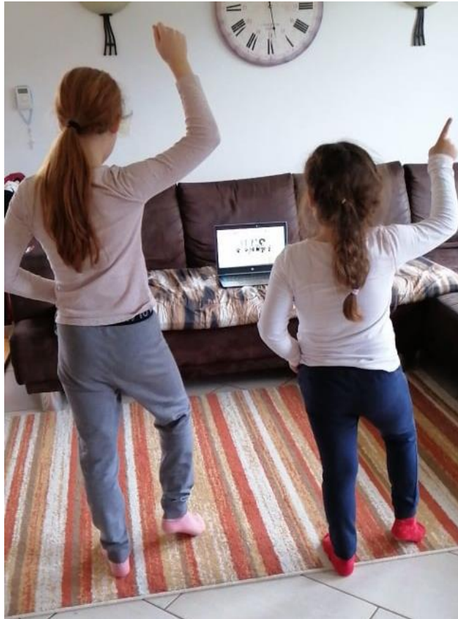
Slika 5: Ples na daljinu.