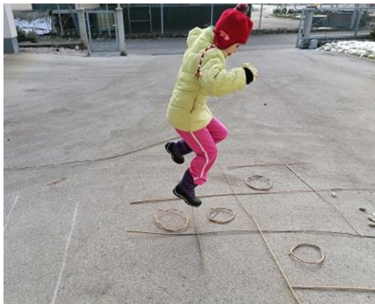
Slika 1: Vlastita igra.

Djeca su uživala i, koristeći vlastitu maštu, stvarala razne igre.