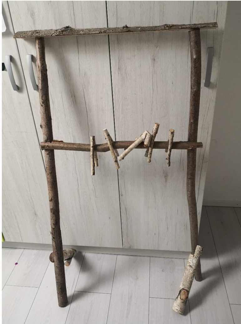
Slika 2: Vlastita igra učenika.