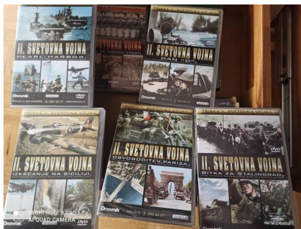
Slika 2, DVD zbirka iz 2. svjetskog rata [2]

U obradi materijala pogledali smo četiri dokumentarca iz zbirke 2. svjetskog rata. Ti filmovi su: „Pad Poljske“, „Bombardiranje Engleske“, „Pearl Harbor“, „Dan "D"“.