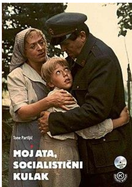
Slika 4, naslovni plakat za film „Moj otac socijalistički kulak“ [4]

Kako bih postigla ciljeve učenja, kako bih olakšala prezentaciju povijesnog razdoblja i života u poslijeratnoj Jugoslaviji, učenicima sam predstavila slovenski film pod naslovom „Moj otac socijalistički kulak“, koji je snimljen 1987. godine i traje 100 minuta.