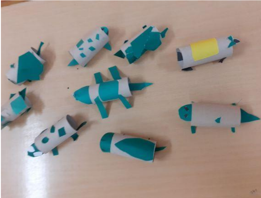
Slika 1. Kornjače od papirnatih roli