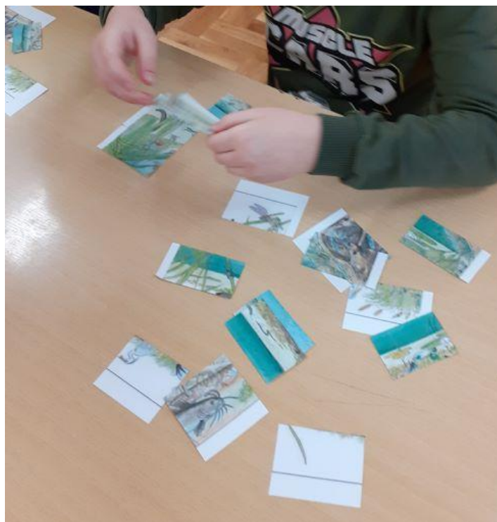
Slika 3. Slaganje puzzle za razvoj kognitivnih vještina