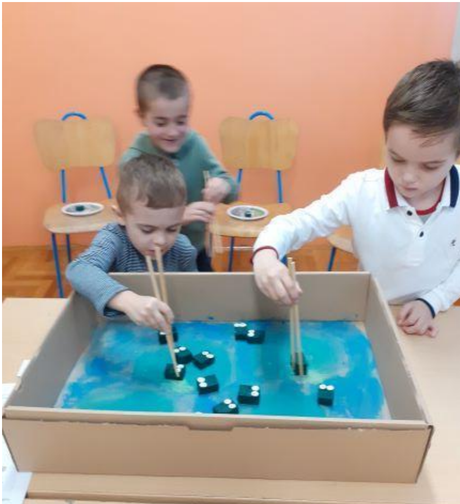
Slika 4. Učenici tijekom igre Rodin kljun

Kutija je močvara, zeleno obojeni komadići stiropora na koje sam zalijepila bijele kružice od papira (oči) su žabe, podlošci u koje sam zalijepila fotografiju rodinih ptica gnijezdo, a štapići rodin kljun. Služeći se samo štapićima u jednoj ruci učenici su lovili žabice te ih premještali u gnijezdo. Zanimljiva vježba fine motorike. Istovremeno se igralo tri učenika. Pobjednik je onaj koji skupi najviše žabica u zadanom vremenu. Pasivno čekanje na sudjelovanje u igri ovakvog tipa može u razredu izazvati "nered". Kako bi zadržala fokus ostali učenici su za vrijeme dok je igrala "jedna postava" slagali puzzle i čekali svoj red. Čekanje nije bilo predugo i broj puzzli bio je relativno mali (16 dijelova).