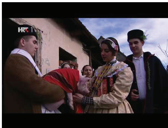
Fotografija 1. Igrano-dokumentarni film Petra Oreškovića Babina Bilka (emisija pučke i predajne kulture, 2012.) u kojemu su uloge tumačili članovi Kulturno-umjetničkog društva Gorjanac. Dostupno na: https://www.youtube.com/watch?v=szTJNBB15N4 .