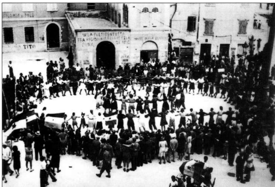
A Rovigno si festeggia la fine della guerra.

nella loro nuova organizzazione ad operare autonomamente, in primo luogo per attuare una soluzione quanto più equa del problema nazionale. In questa loro azione essi furono costretti, come nel passato, a scontrarsi spesso con i massimi esponenti croati. I conflitti si fecero anche aspri specie quando si trattava di affrontare e risolvere le più disparate e spinose questioni del momento nei rapporti comuni. Nonostante ciò, seppure avessero cercato di esercitare in più occasioni una certa apertura nei confronti delle altre forze antifasciste locali, molto deboli e disorganizzate del resto, non rinunciarono mai di mantenere il loro abituale atteggiamento monopolistico e settario, comune del resto a tutti i partiti comunisti. Tendenza questa potenziatasi con l'avvento della linea intransigente del Partito comunista croato, avversa all'attività e all'affermazione di qualsivoglia componente antifascista italiana, che non accettasse la sua supremazia specie nel campo delle rivendicazioni nazionali.