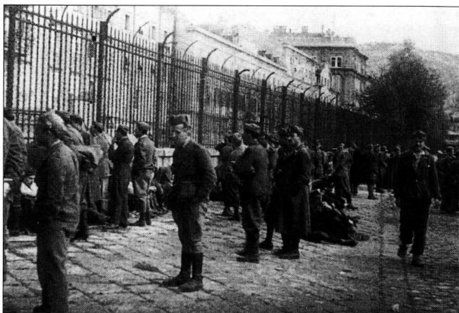
Prigionieri tedeschi a Fiume dopo l'entrata dell'esercito di Tito.

meno, riposta nei confronti della minoranza italiana in genere in caso di sbarco. Una forte apprensione era stata divulgata in questo periodo pure sul pericolo che avrebbe rappresentato la presenza tra le truppe da sbarco di soldati italiani, in rappresentanza del nuovo esercito che operava ormai da tempo nell'ambito delle forze alleate in Italia.