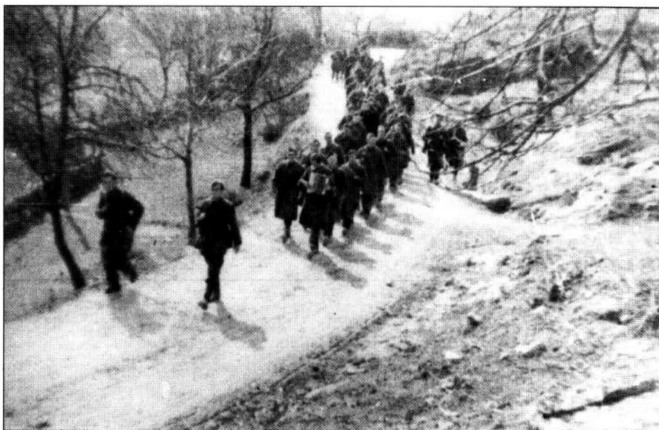
Il battaglione "Pino Budicin" in marcia (Gorski Kotar, marzo 1945).

1944. La principale forza d'urto era costituita dalla brigata "Vladimir Gortan", nell'ambito della quale si distinse in particolare il battaglione italiano "Pino Budicin".