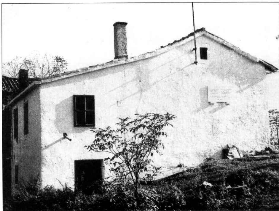
La casa di Camparovica (Albona) dove nel luglio 1944 furono create le basi per la fondazione dell'Unione degli Italiani dell'Istria e di Fiume.

via". Timori questi manifestati soprattutto da parte di commercianti e possidenti. Nella relazione si rileva ancora che diversi italiani di Rovigno e di Pola mantenevano stretti legami con la parte reazionaria di Trieste.