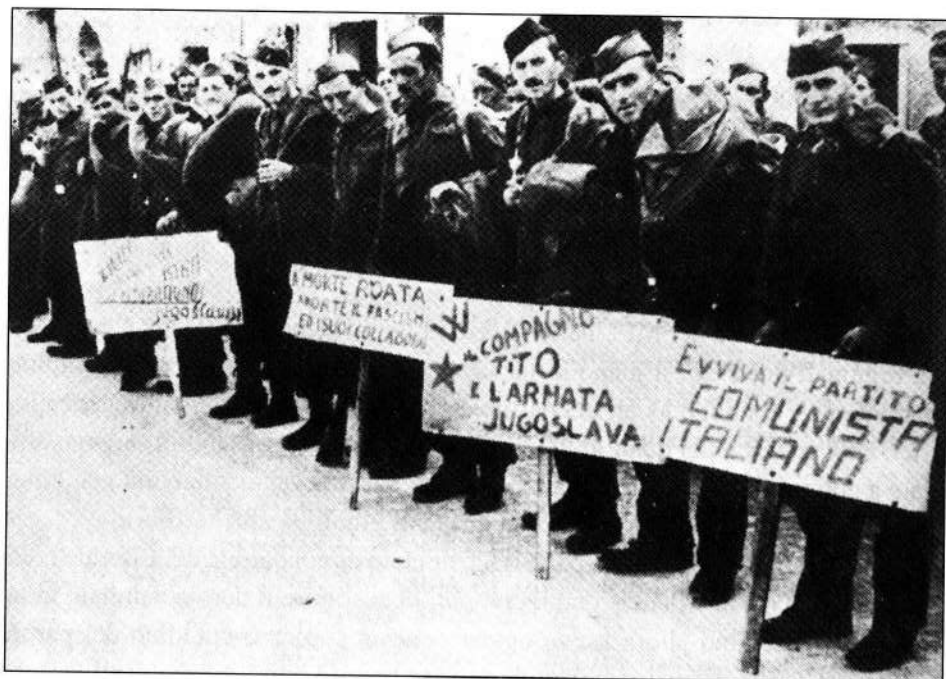
Partigiani italiani nel Movimento popolare di liberazione

politiche ed organizzative che ne potevano derivare, iniziarono ad organizzare per proprio conto comitati regionali, cittadini, di settore e di gruppo a lato delle organizzazioni già esistenti del PCI. 46