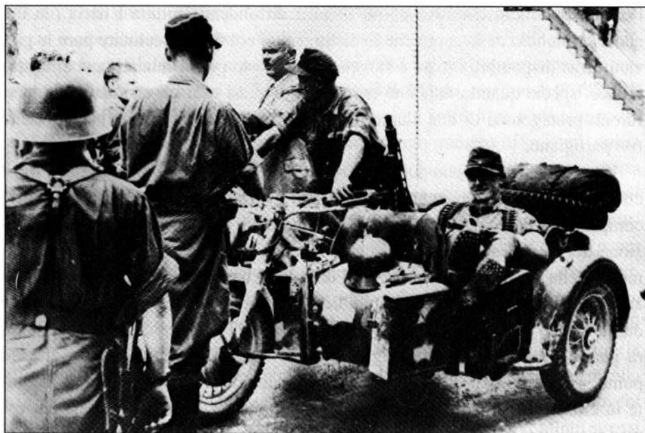
Gruppo di soldati tedeschi a Sušak (15 settembre 1943)

Sušak; e la “R-III” di Udine. Un distaccamento speciale di questa polizia era stato posto a Castelnuovo d’Istria, impegnato soprattutto nella lotta antipartigiana. 15