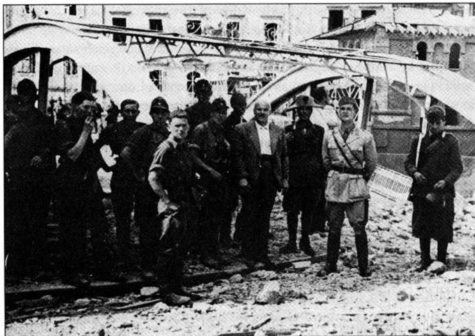
Soldati tedeschi ed italiani sul ponte di Sušak (15 settembre 1943)

Durante l'occupazione tedesca l'antagonismo nazionale segnò pesantemente le scelte e i comportamenti delle genti giuliane. I nazisti studiarono con profitto di attizzare e sfruttare ai loro fini ogni rivalità etnica. 5