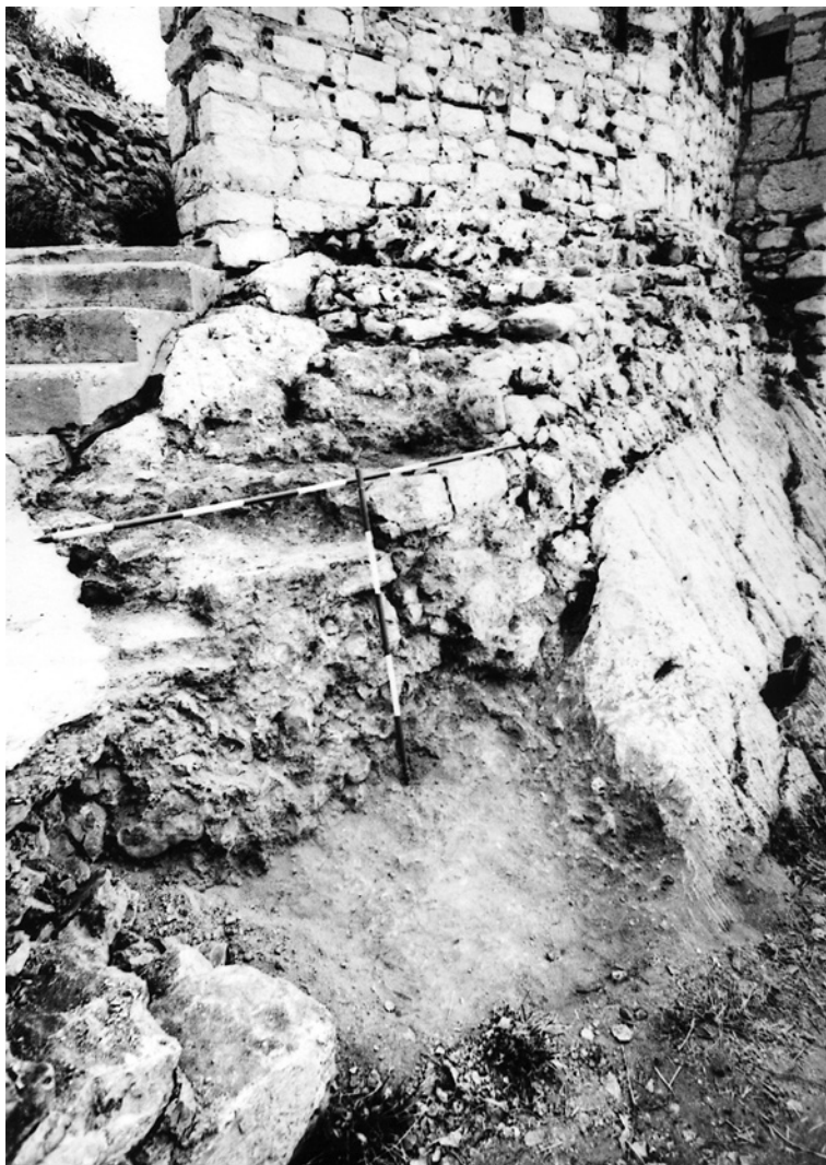
8 Kaštel sv. Mihovila, ostaci stepenica uz jugozapadni bedem

Restauratorski zahvat kojim se pokušalo uspostaviti jedinstvo „srednjovjekovnog” stila na jugozapadnom bedemu kaštela sv. Mihovila metodološka je paradigma pristupa obnovi tvrđave. No, niti ta paradigma na tvrđavi nije provedena