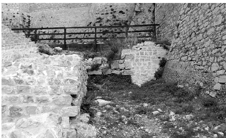
11 Kaštel sv. Mihovila, sjeveroistočni podzid nakon obnove

St. Michael's Fortress, northeast retaining wall after restoration