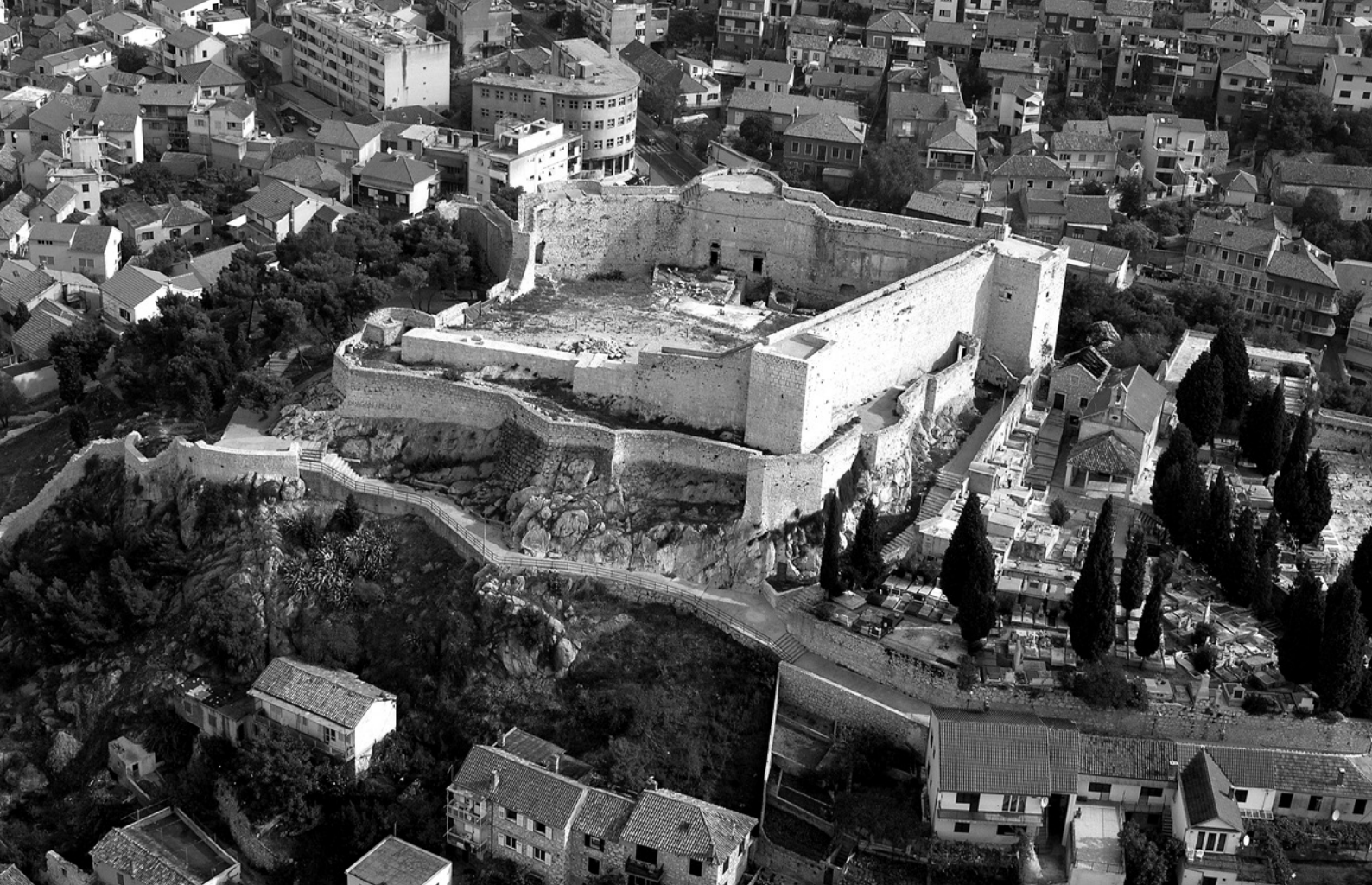
1 Pogled na Šibenik i kaštel sv. Mihovila 2002. godine

View of Šibenik and St. Michael's Fortress in 2002