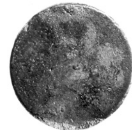
2 Nepoznati majstor, J. J. Klović , The British Museum

Anonymous medallist, G. G. Clovio , The British Museum