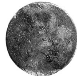
2 Nepoznati majstor, J. J. Klović , The British Museum

Anonymous medallist, G. G. Clovio , The British Museum