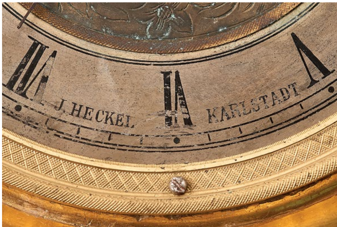
10 J. Heckel, sat u okviru, signatura na brojčaniku