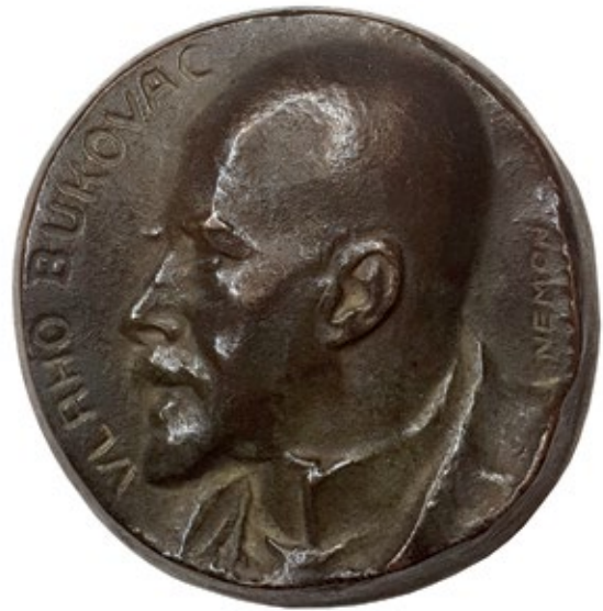
14 Vlaho Bukovac, oko 1933. (?) / c. 1933 jednostrana medalja, lijevana bronca, Ø 72 mm one-sided medal, cast bronze

Estate of Oscar Nemon