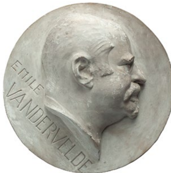
12 Emile Vandervelde, 1932. model za medalju, sadra, Ø 50 cm medal model, plaster

© Estate of Oscar Nemon, © Bibliothèque Royale Belgique