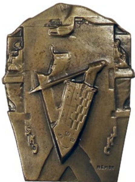
11 Jugoslavenski Sokol, 1931. značka, bronca, 22 × 29 mm pin badge, bronze

Bibliothèque Royale Belgique, Monnaies et Médailles, Bruxelles, inv. br. 2N72/14