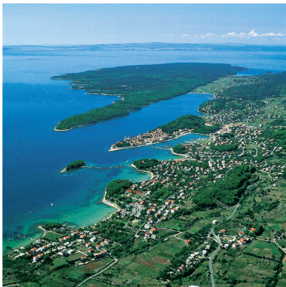
Slika 2: Područje naselja Barbat, Rab i Palit

Kao primjer obrađuje se grad Rab u Primorsko-goranskoj županiji. Otok Rab obuhvaća 102,85 km 2 kopna i 424,52 km 2 mora, slika 2 . Sastoji se od sedam naselja. Po popisu stanovništva 2011. god. je imao 8.065 stanovnika, a gustoća naseljenosti je 78,4 stanovnika/km 2 .