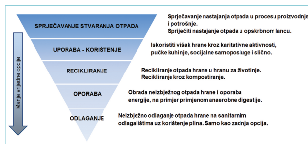
Slika 1: Interpretacija hijerarhije za otpad hrane (prilagođeno Papargyropolou i sur., 2014.)

Djelovanjem bakterija i gljiva, uz prisutnost vlage, otpad se razgrađuje u osnovne organske komponente i CO 2 . To su heterotrofne bakterije ( saprofiti ) i gljive. Vlaga u hrani uvijek ima (do 80 %) tako da razgradnja nastaje brzo. Kad se potroši kisik nastaju anaerobni proces i razgradnja. Proces anaerobne razgradnje proizvodi opasne toksine, te plin metan koji je vrlo jaki staklenički plin. Brzina razgradnje ovisi o temperaturi. Temperature između 15–60 °C su povoljne za razvoj bakterija i razmnožavanje gljiva, a aktivne su i kod nižih. O svemu ovome mora se voditi računa kod upravljanja otpadom hrane kako bi posljedice za čovjeka i okoliš bile što manje. Hijerarhija upravljanja otpadom hrane je slična hijerarhiji upravljanja krutim otpadom, slika 1. (Papargyropolou i sur., 2014.).