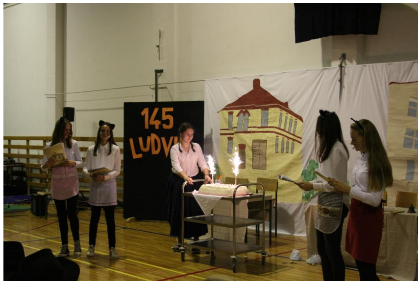
Slika 2: Proslava 145. godišnjice škole.

Umirovljeni učitelji veoma se rado sjećaju trčećih koraka djece koja trče školskim hodnicima, dok su neki od tih učenika kasnije i sami postali učitelji naše škole. Ovo je posebno istaknuto prilikom školskih predstava, odnosno otvorenja izložbi u okviru Izložbe Ludvik. Na te svečane događaje uvijek su pozvani i umirovljeni 'Ludvici', koji se u školu uvijek rado vraćaju.