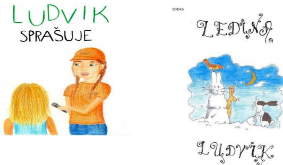
Slika 4 : Naslovnice školskog časopisa Ledina.

Škola se odlikuje sa tri različita školska časopisa. Prvi je Ludvik preporučuje, kojeg stvaraju članovi Ludvik izvještava i namijenjen je svim učenicima i učiteljima naše školi te ga dobivaju svaki mjesec. Drugi naš časopis je Ledina, koju na razrednom stupnju stvaraju mlađi učenici koji pohađaju vannastavne aktivnosti mladi novinar. Ledinu stvaraju i u njenom nastanku sudjeluju članovi obveznog izbornog predmeta školsko novinarstvo i ostali učenici naše škole svojim literarnim i likovnim priložima. Oba časopisa, Ledina i Ludvik, ne izlaze svaki mjesec kao što izlazi Ludvik izvještava, već tri do četiri puta tokom školske godine, dok ponekad izađe i pokojni vanredan broj, poput Ludvik pita.