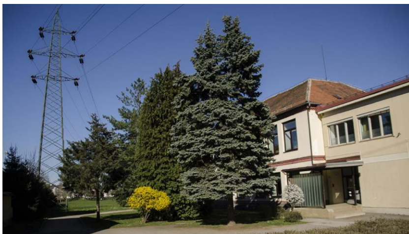
Slika 3: Osnovna škola Ludvika Pliberška Maribor danas.

U unutrašnjosti škole nalaze se tri učionice za prve, druge, treće, četvrte i pete razrede, učionica za kemiju, glazbenu umjetnost, povijest, fiziku, zemljopis, likovnu umjetnost, biologiju i prirodoslovlje te domaćinstvo, informatička učionica s velikim naprednim računalima, učionica za tehniku i tehnologiju te dvije učionice matematike, jedna za nastavu engleskog te dvije za nastavu slovenskog jezika. Uza sve učionice, škola ima i školsku knjižnicu, u kojoj učenici i učitelji mogu besplatno posuđivati slovensku i stranu literaturu. U školi su i mnogi učiteljski kabineti, toaletni prostori, učiteljska zbornica, kuhinja s blagovaonicom, mala i velika dvorana za tjelovježbu.