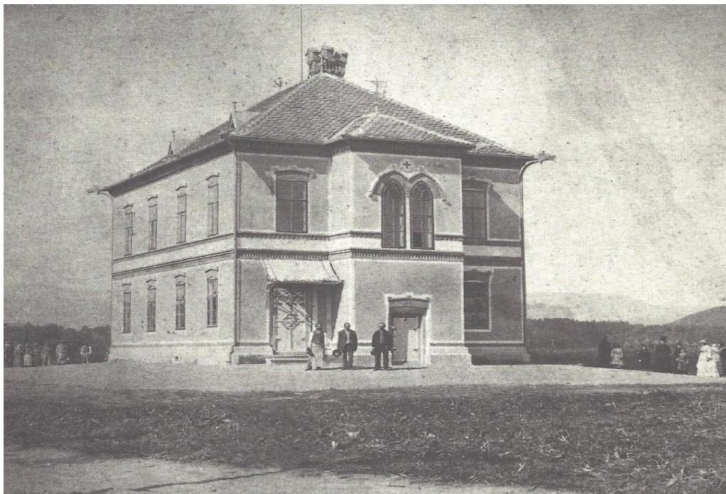
Slika 1: Osnovna škola Ludvika Pliberšeka Maribor nekada.

Osnovna škola Ludvika Pliberšeka ustanovljena je 19. listopada 1872. godine. Svečano otvaranje osnovne škole dogodilo se je 24. svibnja 1873. godine. Tada je nosila ime Volkshule Rothwein, jer je bila njemačka škola. Bila je „jednorazredna“, što znači kako je imala samo jedan razred. Nastava je započela već prvog dana svečanog otvaranja, dok je svečanost otvaranja održana u privremenoj učionici u kući vlasnika dvorca „Pri lipi“. Nastava se je odvijala se na njemačkom, a tek djelomično na slovenskom. Prva školska godina brojila je 94 upisana učenika. Datum početka školske godine nije bio točno određen, već je započinjao na uskršnji utorak, dok su djeca koja su napunila šest godina do uskršnjeg utorka, mogla pohađati školu. Školu su učenici završavali sa napunjenih četrnaest godina. U školi su učili samo gramatiku, čitanje, pravopis i beletristiku, prirodopis, pjevanje, slikanje, ručne radove, tjelovježbu i vjeronauk. Dana 12. srpnja 1873. godine postavljeni su temelji nove škole, koja je 26. lipnja 1874. godine otvorila svoja vrata. Zbog utjecaja njemačkog školskog društva Schulverein, koje je željelo iskorijeniti želju Slovenaca za nastavom na slovenskom jeziku, škola je bila izrazito njemačka [1].