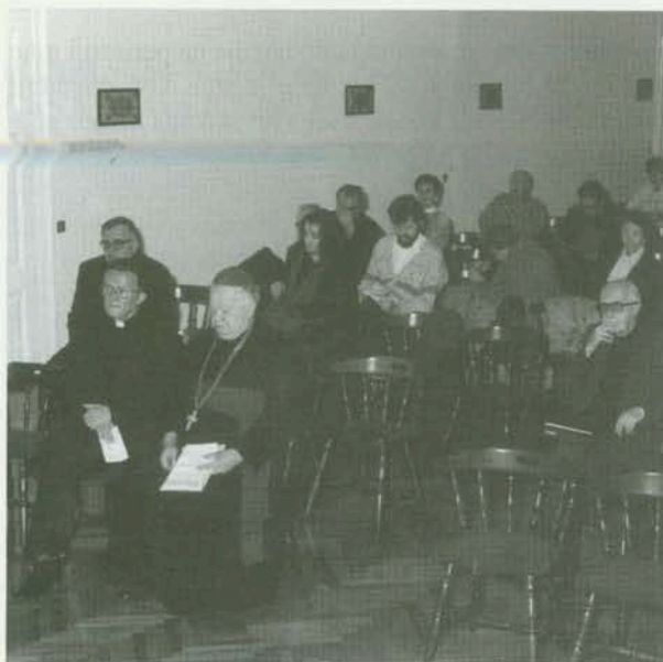
Prisutni pažljivo prate izlaganja

“Pavlinski zbornik jedno je od znatnih rukopisnih djela kajkavskoga 17. stoljeća ne samo po svojem sadržaju, osobito po evanđeoskim tekstovima koji idu među najstarije kajkavske očuvane prijevode Biblije i po svojoj pjesmarici – prvoj kajkavskoj u kojoj su zabilježene i note napjeva – nego i kao jedan od ranih rukopisnih jezičnih spomenika kajkavskoga narječja, te silnica koje su djelovale na kajkavski književni izraz u prvih nekoliko desetljeća njegove potvrđenosti” 3 .