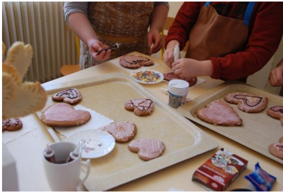
Slika 2: Izrada i ukrašavanje medenih srca