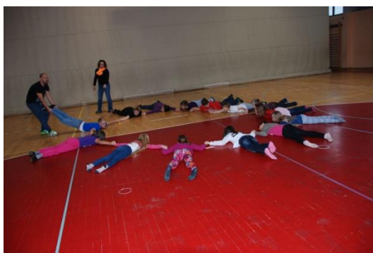
Slika 8: Sportske igre