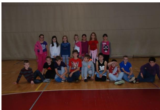
Slika 9: I još foto trenutak za uspomenu