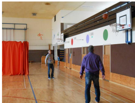
Slika 5: Sportsko druženje učitelja