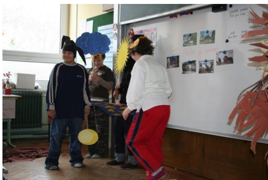
Slika 6: Dramatizacija priče OGLEDALCE