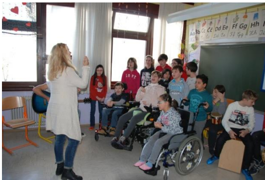
Slika 4: Program dobrodošlice