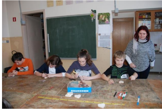
Slika 3: Brušenje drvenih srca