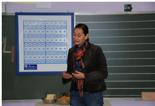
Slika 7: Pozdravni govor g. ravnateljice