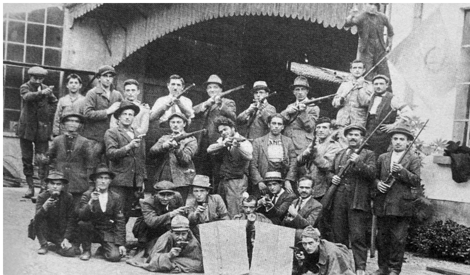
Slika 2. Crvene straže ispred tvornice, vjerojatno u Torinu