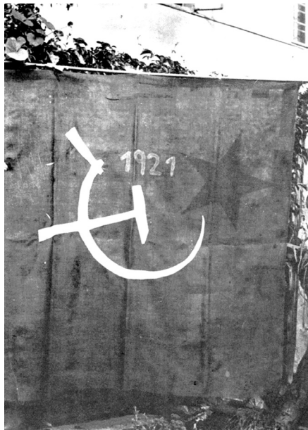
Slika 3. Rudarska crvena zastava iz 1921.