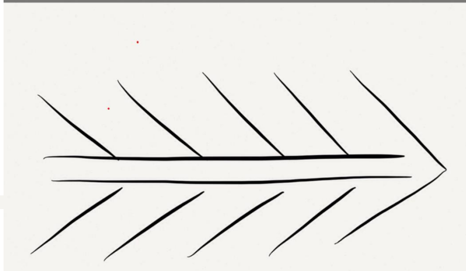
Slika 3, Primjer strategije riblja kost (4)

Unaprijed sam pregledala knjige i časopise dostupne učenicima u učionici i označila važne stranice sa pokazateljima. Nastavne materijale (časopise i knjige) pretraživala sam u školskoj knjižnici. U slučaju da bi učenici sami tražili prikladan materijal u knjižnici, trebalo bi im više vremena za rad. Na raspolaganju su imali: