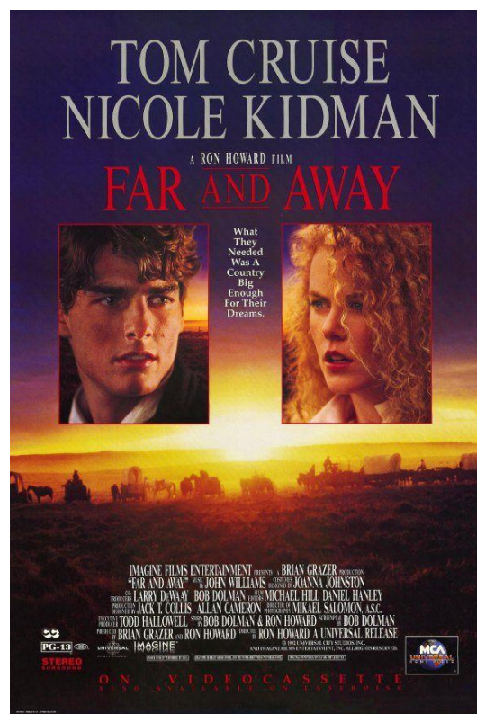
Slika 5, reklama za film Daleko (6)

Također, okrutan život siromašnih europskih doseljenika u Americi je prikazan u filmu „DALEKO“, s originalnim naslovom „Far and Away“, koji je snimljen 1992. godine i traje 140 minuta.