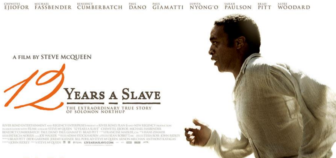
Slika 4, reklama za film 12 godina rob (5)

Uz film, učenici su učili o okrutnom životu američkih robova i porobljavanju slobodnih crnaca Amerike.