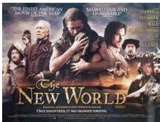
Slika 1, reklama za film Novi svijet (1)

U postizanju sljedećih ciljeva učenja, pomogla sam si filmom pod naslovom „NOVI SVIJET“. Film je snimljen u 2005. godini, traje 176 minuta, a naslov originala je „The New World“.