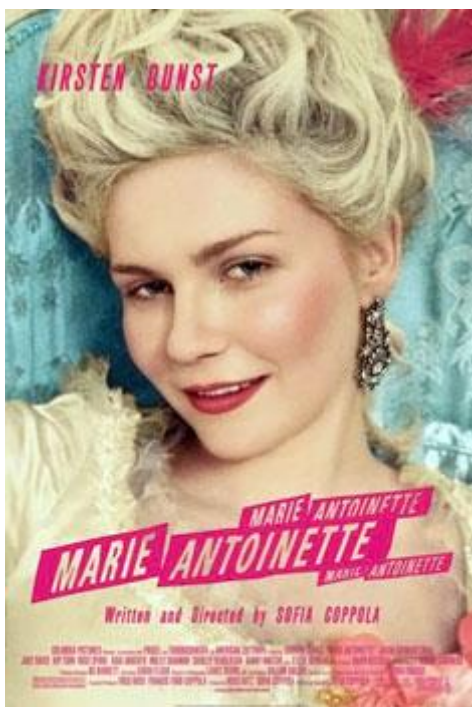
Slika 3, reklama za film Marija Antoaneta (3)

Za pomoć u poznavanju razdoblja Francuske revolucije, pogledali smo film „MARIJA ANTOANETA“ s izvornim nazivom „Marie Antoinette“, koji je snimljen 2006. godine i traje 123 minute.