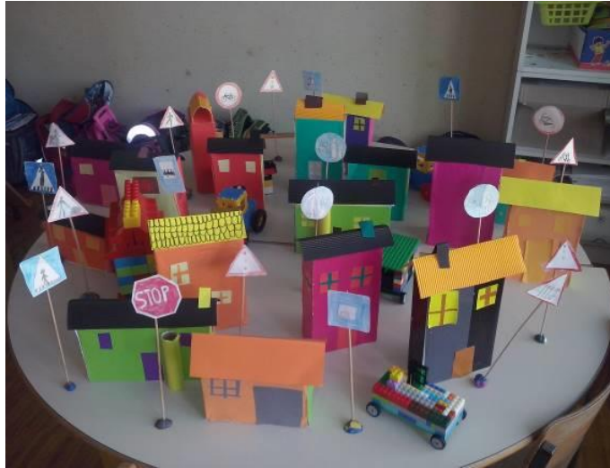
Slika 2: Model prometnih situacija

U sklopu predmeta učenja o okolišu učenici su izradili model prometnih situacija. Izradili su zgrade i prometne znakove. Dodali su vozila i ljude iz lego kockica. Učenici su prikazivali različite prometne situacije koje primjećujemo u našem mjestu [3]. Tijekom igre uloga upozoravali su na vezivanje svih putnika u vozilu.