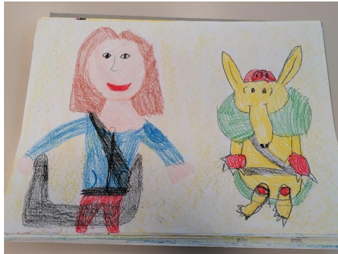
Slika 4 Učenica u autosjedalici

Učenici su nacrtali sebe u automobilu. S njima se uvijek vozi i Pasavček zato se nikada ne zaborave privezati.