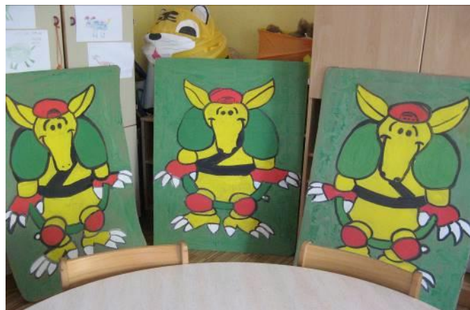
Slika 5: Pasavčki divovi

Učenici su se naučili pjesmicu o Pasancu. Puno puta ponavljamo pjesmicu. Izradili smo i divove pasance i njima ukrasili učionicu.