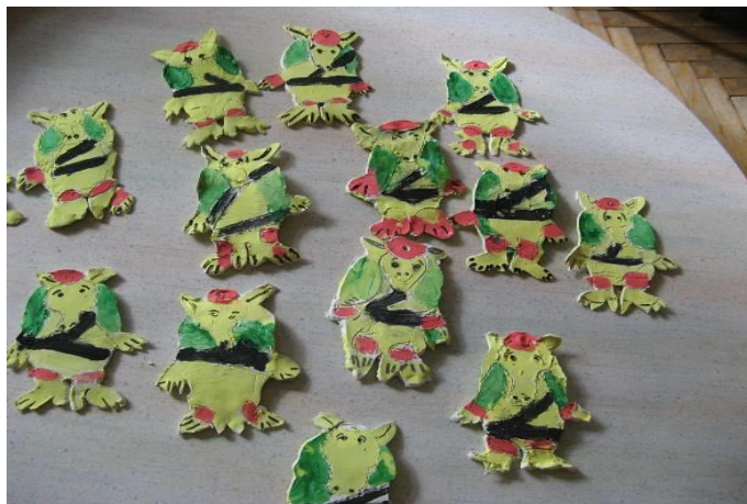
Slika 3: Pasanci iz das mase

Učenici su na likovnoj umjetnosti izradili pasanca: Uzeli su bijelu das masu. Masu su razvaljali. Na nju su položili model pasanca. S modelirkama su oblikovali pasanca. Sljedeći dan, kada su bili dovoljno tvrdi, obojili su ih temperama. Učenici su pasanca koristili kao vješalicu u automobilu.