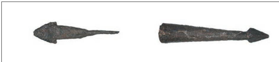
Sl. 20., sl. 21. Vrhovi strelica

namijenjen za lijevu nogu. Ulomci kasnosrednjovjekovne keramike čest su površinski nalaz na lovinačkom području, a veće količine pronalazimo u pećinama kao uobičajenim zbjeglištima u trenucima opasnosti. Iz Medvjede pećine, u kojoj se nalazi i obrambeni suhozid, potječe više ulomaka (sl. 23.), pronađenih nedaleko samog ponora, na desnoj obali. 30