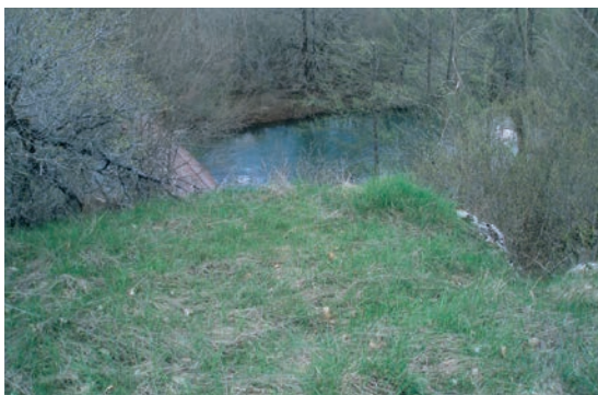
Sl. 8. Terasa Tomičića gradine iznad Ričice

ili Mala i Velika gradina. Riječ je o dvije gradine koje nisu povezane prijevojem, već je između njih vrlo stjenovito sedlo, duboko 20-30 m. Obje uzvisine imaju dva reda suhozidnih bedema, a površinski nalazi obiluju ulomcima keramike. Ispod gradine se nalazi i pripadajuća nekropola. Slučajni nalazi brončanog koplja, ali i brončanih narukvica otvorenih krajeva savijenih u petlju (Ljubić 1876: 13, T. II. 19; 33) pripadaju ovom razdoblju i možebitno potječu s ovog lokaliteta. 8 Kontinuitet života na ovoj gradini nastavlja se i u antici, s obzirom na nalaze rimske keramike na obradivim površinama u polju, nalazu rimskog novca (Patsch 1990: 58), 9 što se može dovesti i u vezu s potencijalnim antičkim lokalitetom Crkvina na položaju današnje Župne crkve sv. Roka.