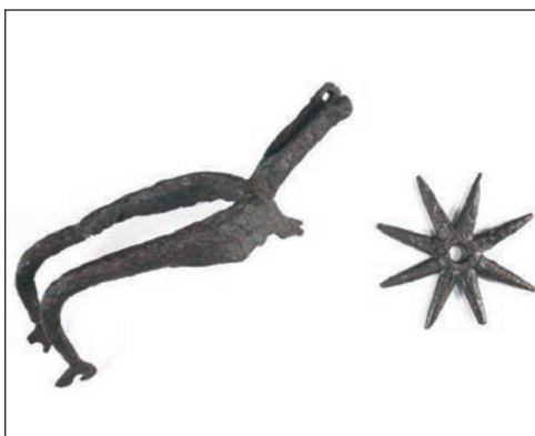
Sl. 22. Konjanička ostruga

Život lovinačkog prostora u osmanlijskom razdoblju, u arheološkom smislu je neistražen. Graditeljske aktivnosti vezane su uz nekoliko tipova utvrđenja, odnosno u samostojeće građevine (turske kule) ili one složenijeg tlocrta te one srednjovjekovne koje su proširene pod Turcima (Horvat 2013: 418). Sve su ove građevine vrlo jednostavnog tlocrta, a danas je prepoznatljiva u prostoru jedino Štulića kula u Gornjoj Ploči (sl. 24.) s donekle očuvanom visinom zida, pa i arhitektonskim detaljima poput prozora. Središnja građevina je kružna kula naslonjena na plašt ogradnog zida s unutarnje strane četvrtastog dvorišta. Uz nju su još evidentirane Batinića kula (možda na Međedači) i Čalića (Šalića ili Čabića kula) četvrtastog