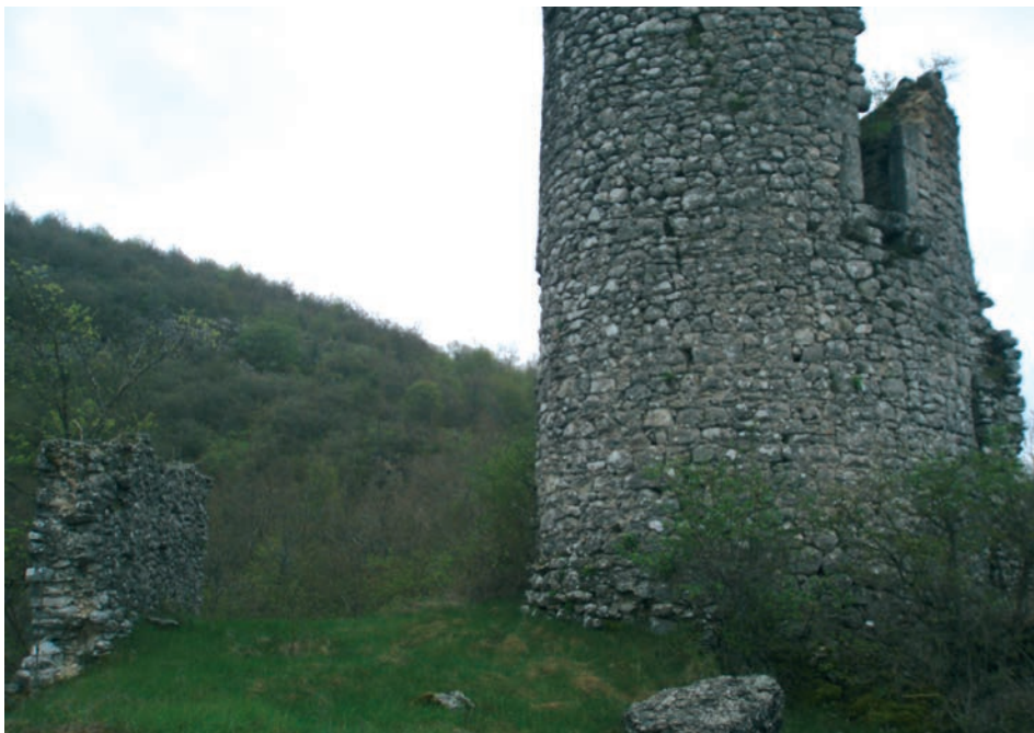
Sl. 24. Pogled na današnje stanje Štulića kule

tlocrta u zaselku Čalići, zabilježene kod Sabljara 1830. I ove su kule bile dio većeg obrambenog sustava koji je podignut na nižim pobrdima Sredogorja i može ga se pratiti u pravilnoj liniji sve do Perušića. 31