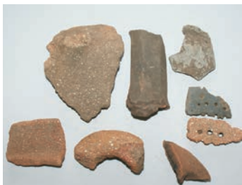
Sl. 4. Keramika sa Cvituše