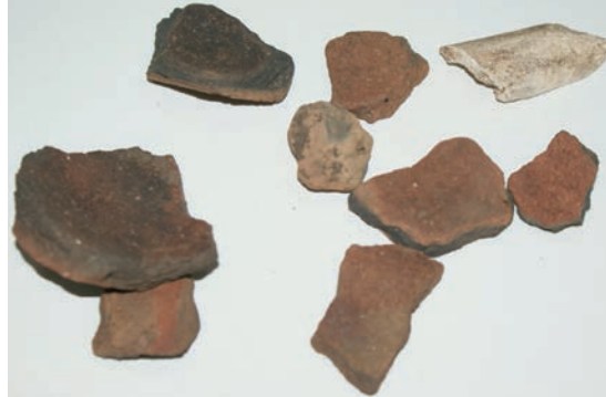
Sl. 9. Keramički nalazi s Tomičića gradine

Kalinića oblaj u Raduču naseljen je već u kasno brončano doba, sudeći po ulomcima keramičkih posuda uglavnom grube fature (sl. 7). 10 U podnožju zapadno, nalazi se