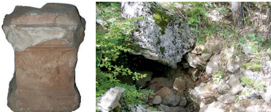
Sl. 17., sl. 18. Zavjetna ara i pogled na Nićino vrelo u Gornjoj Ploči

Svi nalazi na području Ploče upućuju na, očito odavno uništeni antički lokalitet, a s njim u vezu bi se mogao dovesti i podatak da je prilikom izgradnje autoceste uništena nekropola. 22