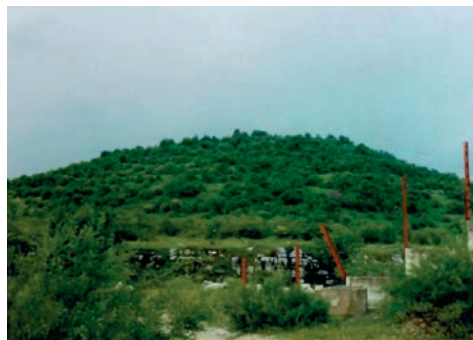
Sl. 3. Cvituša prije devastacije izgradnjom odašiljača

Položaj Cvituše (sl. 3.) u središtu ovog dijela Ličkog polja, geografskog tipa samostalnog i dominantnog uzvišenja, u potpunosti kontrolira prostor. Plato na vrhu je zaravnjen i ogoljene je površine s vrlo plitkim očuvanim humusnim slojem, što se mijenja prema zapadnom i južnom rubu te padinama koje su korištene kao naseobinske terase. Položaj nekropole nije ubiciran, a prema geomorfologiji terena, pretpostavljen je na sjevernoj strani, padinama i zemljanim gredama u polju. Vjerojatno iz ove nekropole potječe rukobran od spiralno savijena 41-og navoja brončane žice, koji svojim analogijama datira u početak starijeg željeznog doba, (9. st. pr. Kr.), što je „našast u starom grobu na desnoj mrtvačkoj ruci u Lovincu“, dok se kontinuitet u mlađe željezno doba može pretpostaviti prema nalazu brončane pincete „našasta kod sv. Mihovilja u Liki“. (Ljubić 1876: 10, 24, T.II/12)