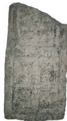
Sl. 14., sl. 15. Lovinačka urna i njen crtež