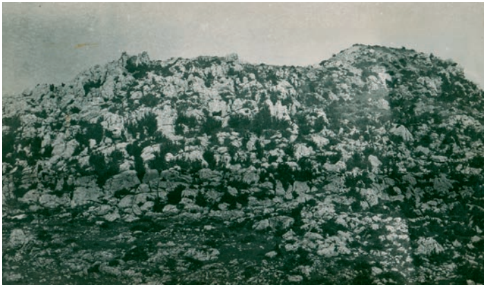
Sl. 19. Raduč grad ili Gajića gradina koju je snimio Većeslav Heneberg, 1923.

Često se kod autora navode i različita nazivlja ovih gradova, pa se u njihovu nabrajanju, multipliciraju brojevi, a ne postoji niti tipološka diferencijacija. Stoga pronalazimo u zajedničkom popisu i srednjovjekovne gradove i turske kule i prapovijesne gradine. Zasigurno potvrđeni u prostoru, kao i povijesnim izvorima i kartografskim prikazima, su stari grad Lovinac, podignut na Gradini ili Serdarskoj gradini u Sv. Roku. Sagrađen je na krševitom i strmom brijegu, obraslom u niže raslinje i hrastovu šumu. Do njega je, smještenog na zaravnjenom platou, vodio vijugav put s jugozapadne strane. U osnovi je imao pravokutni oblik, duže strane 33 m, a uže 19 m. Mjestimice je zid metar debljine očuvan u visini od 1 do 3 m. S unutarnje strane gradskih zidina vide se ostaci dviju kružnih obrambenih kula.