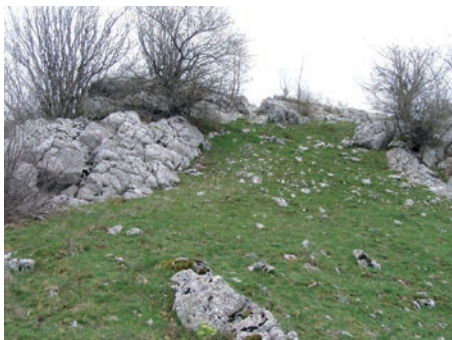
Sl. 2. Naseobinska terasa na Piplici