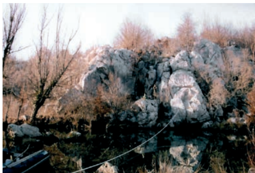
Sl. 13. Pogled preko Jadove na „špilju 2“

Podno Krkenjače proteže se i Vranički klanac koji je u kontekstu povijesnih komunikacija između Ličkog i Kravskog polja iznimno važan. 15 Istraženi pe-