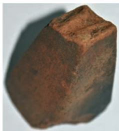
Sl. 5. Piramidalni uteg