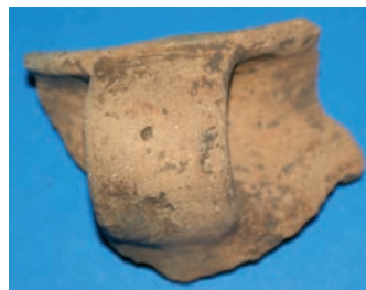
Sl. 6. Dio šalice

ci koriste se za čuvanje i pripremanje hrane. Prisutno je i finije posuđe, tanjih ili potpuno tankih stijenki, glačane površine, ukrašavanih fasetiranjem na ručkama ili samom obodu posude. Tipološki pripadaju lončićima, šalicama ili zdjelicama. Nekoliko ulomaka pripada cjediljkama.