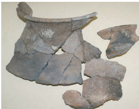
Sl. 10. Izbor keramičkih nalaza iz Brkića pećine

blago razgrnutim prema van (sl. 10.), od pročišćene gline s dodanim sitnim i srednje krupnim kalcitnim primjesama. Površina je glačana, na nekim mjestima s ostatkom tanke skrame. Tipološki pripada velikim posudama – loncima za čuvanje hrane. Slične primjerke nalazimo u Jankuša pećini kod Ličkog Novog (Osterman 2008: 42, T.VI/3,4), Bezdanjači (Drechsler-Bižić 1979: 64-65, 67-68, T.XXVIII/2, T. XXX/1, T.XXXVII/4) i dr.