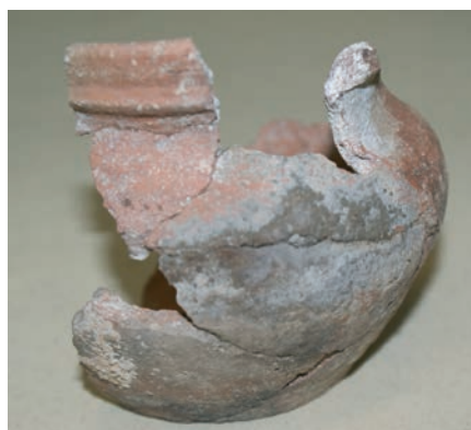
Sl. 23. Keramički kasnosrednjovjekovni vrč