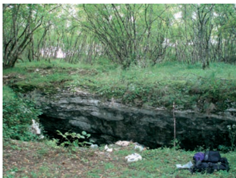
Sl. 11., sl. 12. Unutrašnjost i ulaz u Goveđu pećinu