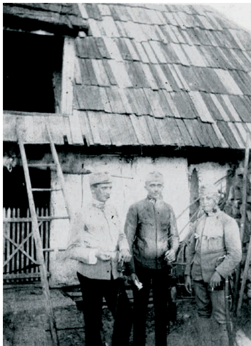
Sl. 4. HR-DAGS-185/16-249. Otočac – I. svjetski rat, 1915.

Razglednice su do nedavno najčešće bile sastavni dio zbirke fotografija u većini ustanova koje čuvaju fotografije i razglednice poput državnih arhiva, muzeja i knjižnica. Tako su jedno vrijeme i u Državnom arhivu u Gospiću bile u sastavu Zbirke fotografija. Nakon provedenog postupka obrade i sređivanja zbirke izdvojene su i formirane kao zasebna cjelina i zbirka te zato nisu prikazane u Pregledu arhivskih fondova i zbirki RH izdanom 2006. godine.