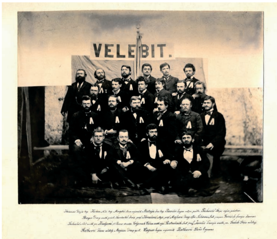
Sl. 5. HR-DAGS-116. Fotografija Pjevačko društvo Velebit

može vizualizirati konvencionalne zapise rukopisnog ili tiskanog gradiva. Primjer su fotografija i arhivalija Pjevačkog društva Velebit u HR-DAGS-206. Zbirci arhivalija u kojoj imamo rukopisnu zahvalnicu Društva upućenu poglavitom gospodinu Emanuelu Alkoviću u Zagrebu iz 1882. godine te fotografiju članova Društva.