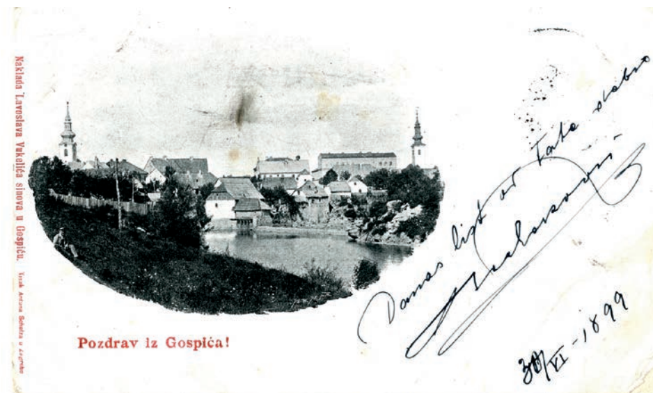
Sl. 7. HR-DAGS-185/5-50. Gospić, Pozdrav iz Gospića; 1899.; dopisnica – levelezo – lap; dopisnica s c/b litografijom koja prikazuje Gospić – pogled s Novčice; tekst poruke napisan pored fotografije; Naklada Lavoslava Vukelića sinovi, Gospić; tisak Antuna Scholza u Zagrebu; 14 × 8,6 cm; akv. br. 116/2002.

kata u socijalizmu nije cijenila kulturnu baštinu historicizma za što je sačuvano mnogo primjera.