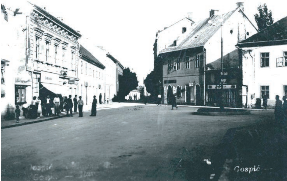
Sl. 8. HR-DAGS-185/5-34. Gospić, Centar Gospića; razglednica na kojoj je c/b fotografija centra grada; 13,9 × 8,9 cm; akv. br. 116/2002.

sređivanje i počinje zaštita. Samo tehničko sređivanje fonda ili zbirke ujedno je i rad na zaštiti.“ (Kovačec 2005: 79) Polazeći od smjernica koje su dali razni stručnjaci koji su se bavili područjem fotografija u arhivistici poput Baričević, Dabac, Gržina, Kovačec i Mušnjak, Državni arhiv u Gospiću nastoji izdvojiti fotografije iz konvencionalnog gradiva arhivskih fondova i zbirki i fizički ih smjestiti u isti spremišni prostor koji daje najbliže mogućnosti optimalnim uvjetima čuvanja. Negativi se drže odvojeno od fototeke ostalog fotografskog gradiva. Idealnu temperaturu i vlažnost zraka za čuvanje fotografija je jako teško u praksi postići. One za razliku od konvencionalnog gradiva na papiru zahtijevaju za čuvanje znatno niže vrijednosti relativne temperature i vlage, osjetljive su na svjetlo i izvore zagađivača zraka. 11 Pri rukovanju s fotografijama koriste se pamučne rukavice. Fotografije se ulažu i pohranjuju u posebne polietilenske, polieterske melinex