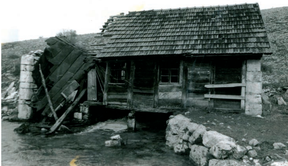
Sl. 1. HR-DAGS-31. (veza kut. 249.) Mlin na Krbavici