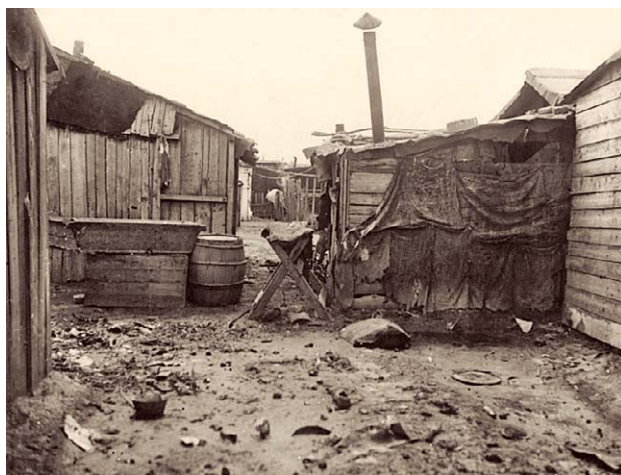
SLIKA 12. NASTAMBE U BARAKAMA IZA GIMNAZIJE U KLAJČEVOJ ULICI, 1924., CRNO-BIJELA FOTOGRAFIJA, HRVATSKI MUZEJ MEDICINE I FARMACIJE HAZU-A, INV. BR. HMMF-4623

FIGURE 10. HOUSING MISERY IN ZAGREB IN 1924, CROATIAN MUSEUM OF MEDICINE AND PHARMACY OF THE CROATIAN ACADEMY OF SCIENCES AND ARTS, INV. NO. HMMF-2599