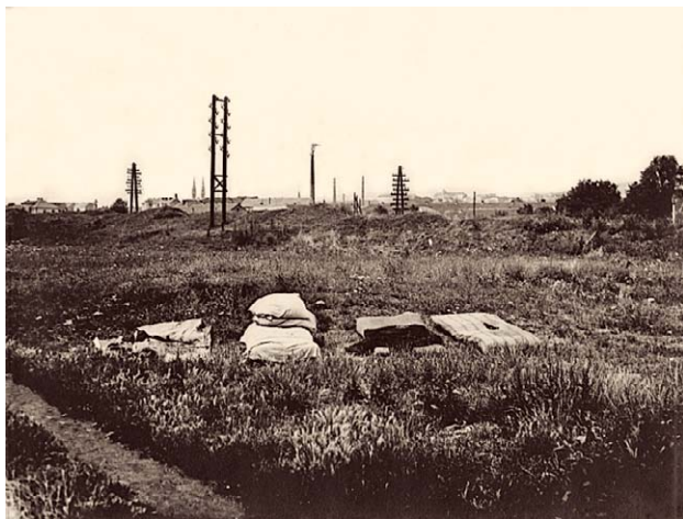
SLIKA 1. LJETNA SPAVAONICA, 1924., CRNO-BIJELA FOTOGRAFIJA, KAŠIRANA NA KARTON KAO EKSPONAT ZA MUZEJ ZA POVIJEST ZDRAVSTVA U HRVATSKOJ, HLZ, 1944.; DANAS U ZBIRCI FOTOGRAFIJA HRVATSKOG MUZEJA MEDICINE I FARMACIJE HAZU-A, INV. BR. HMMF-4620

FIGURE 1. SUMMER DORMITORY , 1924, BLACK AND WHITE PHOTOGRAPH, LAMINATED ON CARDBOARD AS AN EXHIBIT FOR THE MUSEUM OF THE HISTORY OF HEALTH CARE IN CROATIA, CROATIAN MEDICAL ASSOCIATION, 1944; TODAY IN THE COLLECTION OF PHOTOGRAPHS OF THE CROATIAN MUSEUM OF MEDICINE AND PHARMACY OF THE CROATIAN ACADEMY OF SCIENCES AND ARTS, INV. NO. HMMF-4620