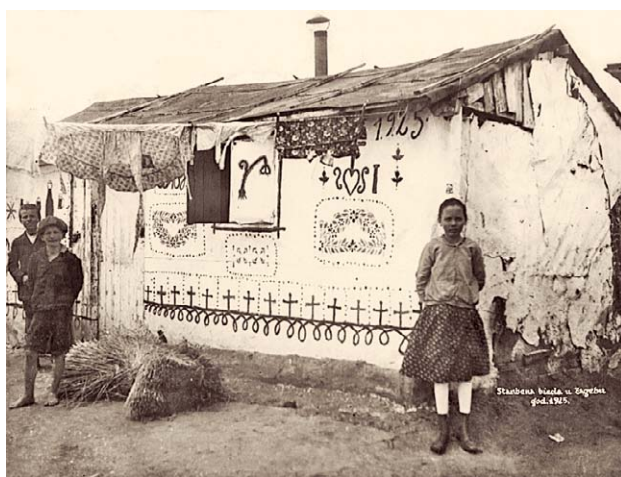
SLIKA 13. STAMBENA BIJEDA U ZAGREBU 1925., CRNO-BIJELA FOTOGRAFIJA, HRVATSKI MUZEJ MEDICINE I FARMACIJE HAZU-A, INV. BR. HMMF-4624

FIGURE 11. ZAGREB HOUSING MISERY 1924, CROATIAN MUSEUM OF MEDICINE AND PHARMACY HAZU, INV. NO. HMMF-2603