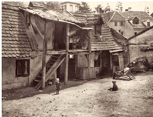
SLIKA 8. TKALČIĆEVA ULICA, 1924., CRNO-BIJELA FOTOGRAFIJA, INV. BR. HMMF-4622

Uz interijere, niz impresivnih fotografija prikazuje i eksterijere, vrlo često u samom središtu grada, primje-