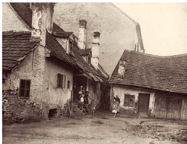
SLIKA 9. STAMBENA BIJEDA U VLAŠKOJ ULICI U ZAGREBU 1924. GODINE, CRNO-BIJELA FOTOGRAFIJA, INV. BR. HMMF-4626

FIGURE 8. TKALČIĆEVA STREET, 1924, BLACK AND WHITE PHOTOGRAPH, INV. NO. HMMF-4622