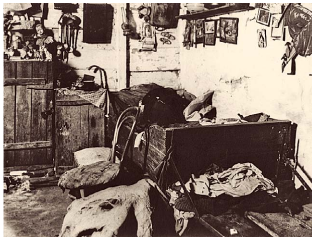
SLIKA 2. STAN U BARACI U ZAGREBU, 1924., CRNO-BIJELA FOTOGRAFIJA, HRVATSKI MUZEJ MEDICINE I FARMACIJE HAZU-A, INV. BR. HMMF-4621

Fotografije koje su bile izložene u Umjetničkom paviljonu, a poslije u sklopu Muzeja za povijest zdravstva, pojedinačno ili kao cjelina, spajanjem fotografskog jezika i socijalne drame koju prikazuju potiču snažne emocije. Dobar uvod u ovo prikriveno naličje grada na pragu industrijalizacije ilustrira fotografija ironično naslovljena Ljetna spavaonica (slika 1.) koja prikazuje improvizirane krevete na livadi prigradskog područja nadomak industrijske zone Zagreba. U prvom planu usred bujne trave nalaze se četiri „ležaja“ koji se sastoje od pohabanih prostirka, jastuka i pokrivača. U pozadini se vide stupovi dalekovoda, tvornički dimnjaci, krovovi kuća, a kako promatrač ne bi bio u