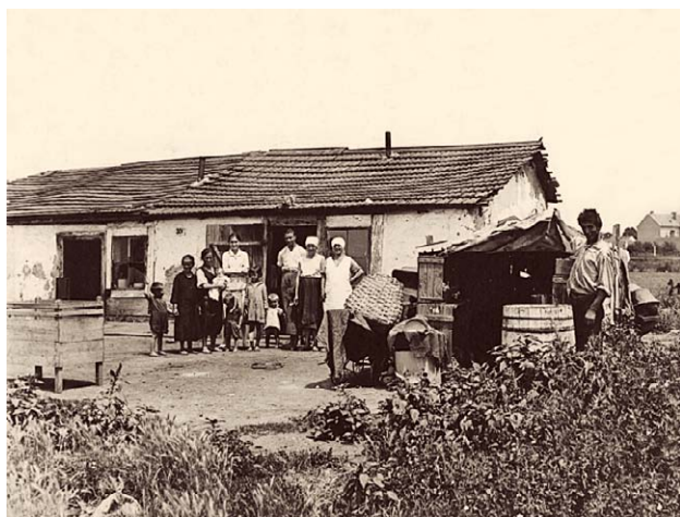
SLIKA 10. STAMBENA BIJEDA U ZAGREBU 1924., CRNO-BIJELA FOTOGRAFIJA, HRVATSKI MUZEJ MEDICINE I FARMACIJE HAZU-A, INV. BR. HMMF-2599

FIGURE 10. HOUSING MISERY IN ZAGREB IN 1924, CROATIAN MUSEUM OF MEDICINE AND PHARMACY OF THE CROATIAN ACADEMY OF SCIENCES AND ARTS, INV. NO. HMMF-2599