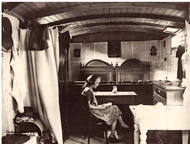
SLIKA 7. VAGONSKI STAN – STAMBENA BIJEDA U ZAGREBU 1924., CRNO-BIJELA FOTOGRAFIJA, HRVATSKI MUZEJ MEDICINE I FARMACIJE HAZU-A, INV. BR. HMMF-2604

FIGURE 7. WAGON APARTMENT – RESIDENTIAL MISERY IN ZAGREB IN 1924, BLACK AND WHITE PHOTOGRAPH, CROATIAN MUSEUM OF MEDICINE AND PHARMACY OF THE CROATIAN ACADEMY OF SCIENCES AND ARTS, INV. NO. HMMF-2604