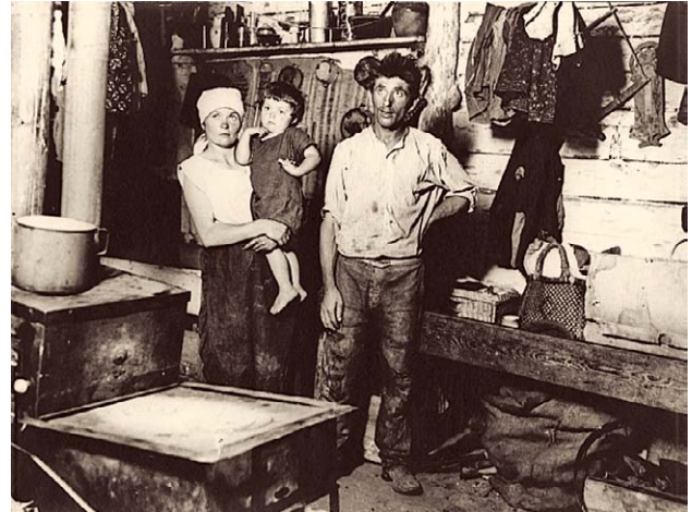
SLIKA 5. STAN U BARACI NA ŽITNJAKU U ZAGREBU, 1924., CRNO-BIJELA FOTOGRAFIJA, HRVATSKI MUZEJ MEDICINE I FARMACIJE HAZU-A, INV. BR. HMMF-2605

FIGURE 3. POOR ROOM IN ZAGREB IN 1924, BLACK AND WHITE PHOTOGRAPH, CROATIAN MUSEUM OF MEDICINE AND PHARMACY OF THE CROATIAN ACADEMY OF SCIENCES AND ARTS, INV. NO. HMMF-4627