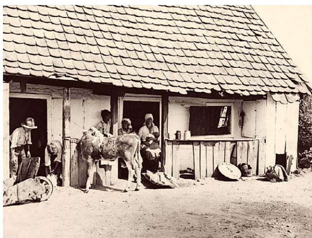
SLIKA 11. ZAGREBAČKA STAMBENA BIJEDA 1924., CRNO-BIJELA FOTOGRAFIJA, HRVATSKI MUZEJ MEDICINE I FARMACIJE HAZU-A, INV. BR. HMMF-2603

FIGURE 12. HOUSING IN THE BARRACKS BEHIND THE GYMNASIUM IN KLAJČEVA STREET, 1924, CROATIAN MUSEUM OF MEDICINE AND PHARMACY OF THE CROATIAN ACADEMY OF SCIENCES AND ARTS, INV. NO. HMMF-4623