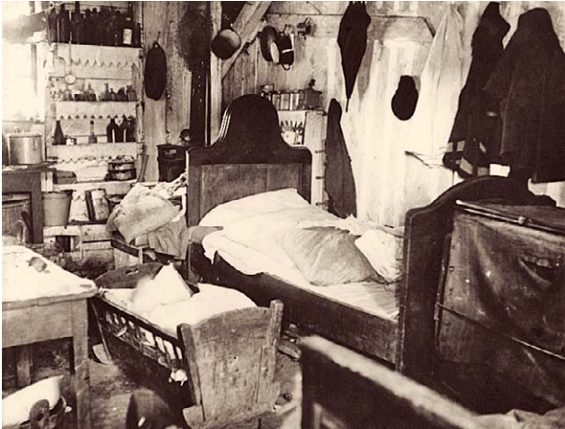
SLIKA 3. SIROTINJSKA SOBA U ZAGREBU 1924. GODINE, CRNO-BIJELA FOTOGRAFIJA, HRVATSKI MUZEJ MEDICINE I FARMACIJE HAZU-A, INV. BR. HMMF-4627

FIGURE 3. POOR ROOM IN ZAGREB IN 1924, BLACK AND WHITE PHOTOGRAPH, CROATIAN MUSEUM OF MEDICINE AND PHARMACY OF THE CROATIAN ACADEMY OF SCIENCES AND ARTS, INV. NO. HMMF-4627