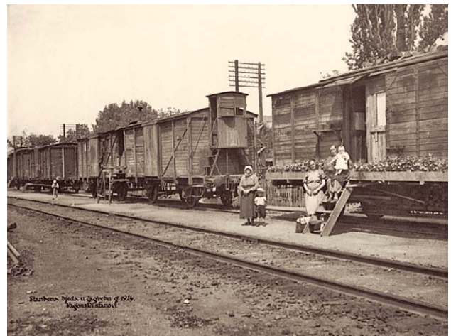
SLIKA 6. STAMBENA BIJEDA U ZAGREBU 1924. GODINE – VAGONSKI STANOVNI, CRNO-BIJELA FOTOGRAFIJA, HRVATSKI MUZEJ MEDICINE I FARMACIJE HAZU-A, INV. BR. HMMF-4625

FIGURE 4. APARTMENT OF THE SOCIALLY ENDANGERED IN ZAGREB, 1924, BLACK AND WHITE PHOTOGRAPH, CROATIAN MUSEUM OF MEDICINE AND PHARMACY OF THE CROATIAN ACADEMY OF SCIENCES AND ARTS, INV. NO. HMMF-2601