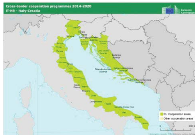
Slika 3. Teritorijalna suradnja