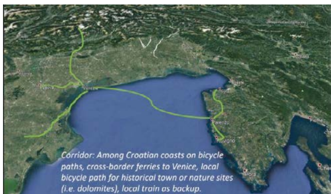
Slika 4. Teritorijalna povezanost

Prema toj logici, partneri će provesti osam pokušajnih projekata i ispitivanja, počevši od usklađivanja voznog reda preko car/bike sharinga , ICT rješenja za kontinuirani tok razmjena informacija, integriranih i multimodalnih sustava plaćanja i dinamičnih sustava za planiranje putovanja do prekogranične intermodalne usluge. Navedene će se aktivnosti testirati u talijanskim regijama Emilia-Romagna, Abruzzo, Veneto, Friuli Venezia Giulia te u Primorsko-goranskoj županiji.