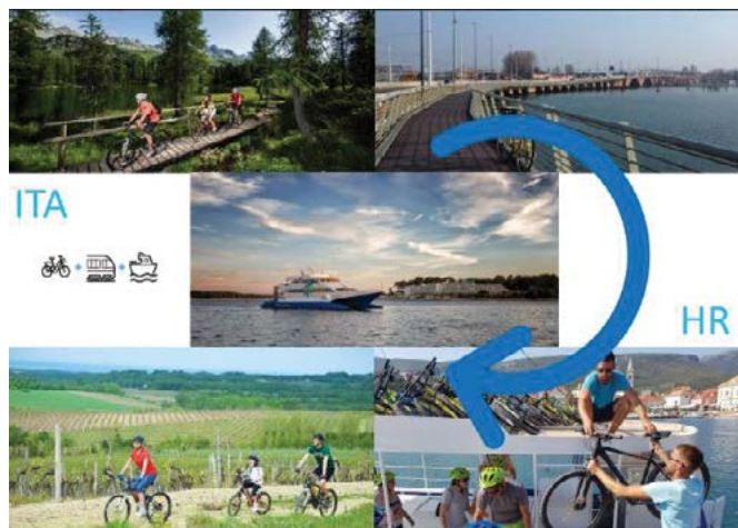
Slika 2. Unapređenje usluge

Kampanje za podizanje razine svijesti korisnika prijevozne usluge održavat će se periodično kako bi se maksimizirao utjecaj novih rješenja (organizacija događanja za javnost, nagradne igre u kojima će dobitnici moći ostvariti popust na vožnje i slično). ICARUS u svoju politiku mobilnosti želi uvesti i čimbenik smanjenja potrošnje energije, ne toliko iz tehnološkog aspekta, već da se kod građana razvije svijest o tome prilikom planiranja putovanja. Trenutačno nedostaje inovativni pristup koji bi unaprijedio svladavanje prepreka i uvođenje inovacija u prekograničnu suradnju najviše zaknutih područja Hrvatske i Italije. ICARUS će također razviti prekograničnu platformu za učenje kako bi svim zainteresiranim omogućio ne samo razmjenu iskustava i učenja na primjerima najbolje prakse, već i kako bi stvorio bazu podataka za buduće naraštaje.