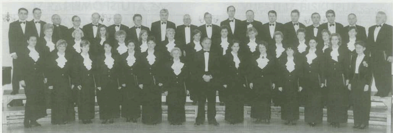
Katedralni mješoviti zbor iz Zagreba

zborova Hrvatske 1993., te ženskog ansambla Zbora 1996. i srebrna plaketa u Zagrebu ove godine) i međunarodnim natjecanjima (brončana medalja Rim 1995., Limburg 1996., Litomyšl 1997., Jeruzalem 1997., Zwickau 1998. i Tampere 1999.).