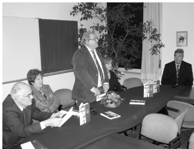
Detalj s predstavljanja knjižice na FKIT-u, 31. ožujka 2008. godine