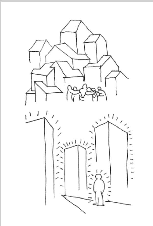
Sl. 2 Teza o izraženom otuđenju novih naselja pojačana je sugestivnom upotrebom ilustracija—karikatura i creža belgijskih i francuskih autora—koje kondenziraju negativne stereotipe o kolektivnom stanovanju. Munchov Krik (Sl. 1) doslovno se seli u kolektivna stambena naselja, a egzistencijalni očaj centralne figure postaje zdvajanje nad funkcionalističkom arhitektuom. „Graditelj tornjeva usamio je čovjeka”, stoji uz grafički prikaz razlika između tradicionalnih i modernih naselja. Jedan jedini lik u podnožju nebodera u kontrastu s afektivnom grupom u starom naselju pojačava argumentaciju o dehumanizirajućem djelovanju novih naselja. / Fig. 2 The thesis of the people's profound alienation in the new housing developments is intensified by the use of illustrations—caricatures and drawings of the Belgian and French authors which encourage negative stereotypes about it. Munch's Scream (Fig. 1) was literally moved into Mass Housing surroundings, and the central figure's existential despair was turned into a despair over the functionalist architecture. “The builder of the towers made man lonely”, stands next to a drawing that shows differences between traditional and modern settlements. A single person standing below the tower opposed to a group of happy people in an old settlement supports the argument about dehumanizing effects of new settlements. (Rudi Supek, Grad po mjeri čovjeka , Zagreb, 1987.).