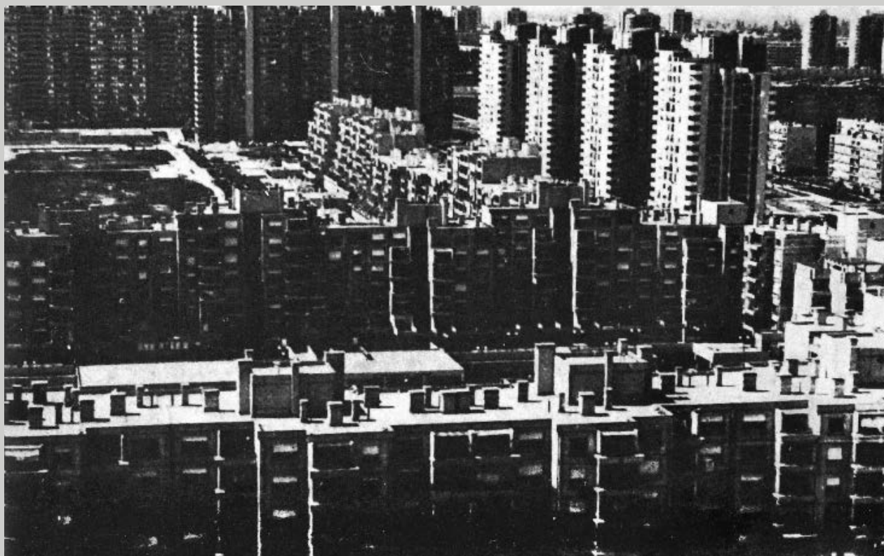
Sl. 3 Slike se tendenciozno primjenjuju za isticanje razlika zagrebačkog centra i Novog Zagreba: dok je prvi ilustriran fotografijom Zrinjevca, potonji je predstavljen kao „prostor-spavaonica” Travno koje na fotografiji djeluje kao beskrajno protezanje betona. / Fig. 3 The photos are tendenciously used to emphasize the differences between the Zagreb city center and the New Zagreb. While the first one is presented with a photo of Zrinjevac Park, the latter is shown as a vast “dormitory” Travno—endless rows of concrete blocks. (Rudi Supek, Grad po mjeri čovjeka , Zagreb, 1987).