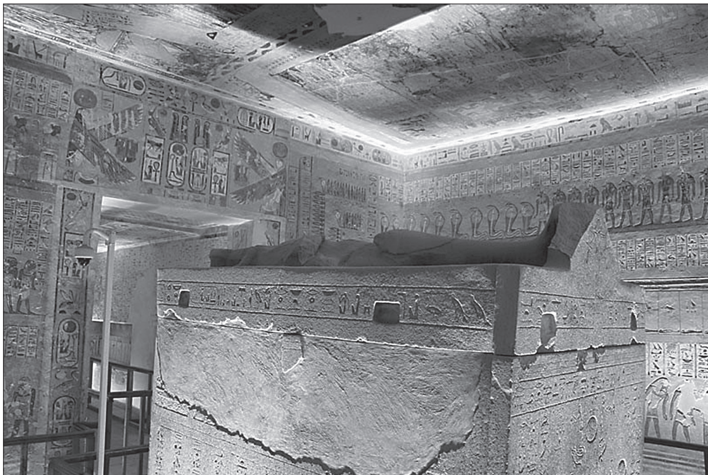
Grobnica Ramzesa IV. u Dolini kraljeva

Iščitava se, primjerice, da će se oni, koji su uzeli životinju na božjem imanju, kazniti odsijecanjem nosa i ušiju. Čini se da bi individualan prijestup mogao imati posljedice i na cjelokupnu obitelj koja je snosila posljedice uz kaznenoga prijestupnika. Što se tiče državnih dužnosnika koji bi počinili neke ilegalne radnje bili bi kažnjeni s 200 udaraca i 5 otvorenih rana (Edgerton, 1947: 224).