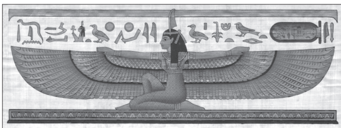
Maat – božansko utjelovljenje egipatskoga zakona i pravde

nosila nojevo perje na glavi, jedno od najvidljivijih aspekata egipatske države i njezina religijskoga sustava (VerSteeg, 2002: 3). Status koncepta i božice Maat, u egipatskom je društvu, nadišlo samu koncepciju njezina značenja moćnoga egipatskoga božanstva. To je bio koncept koji je prožimao svaki zamislivi aspekt njihova postojanja. Pojam je teško prevodiv jer obuhvaća mnoštvo pojmova koje on predstavlja. Može se prevesti kao zakon, pravda, istina, poredak ili kozmos i na neki način on predstavlja sve to zajedno. 2 Utjelovljen u božici, taj je pojam bio vodeće načelo egipatskoga pravnoga sustava. Predstavljao je kozmički poredak i prirodnu ravnotežu te obuhvaća vjerske, etičke, moralne i političke konotacije. Maat se može shvatiti i kao društveni ugovor sličan prirodnom zakonu – on povezuje sve i sve koji postoje, a to znači da povezuje one najviše s najnižima – od bogova do faraona pa od faraona do običnoga seljaka (Manning, 2012: 114-116).