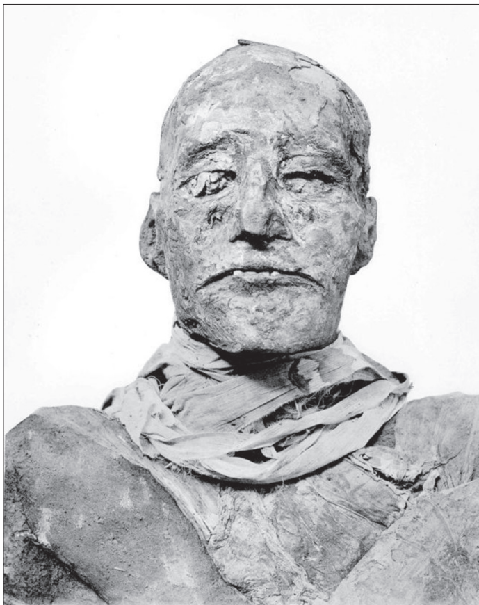
Mumija faraona Ramzesa III. (oko 1295. – oko 1188. prije Krista)