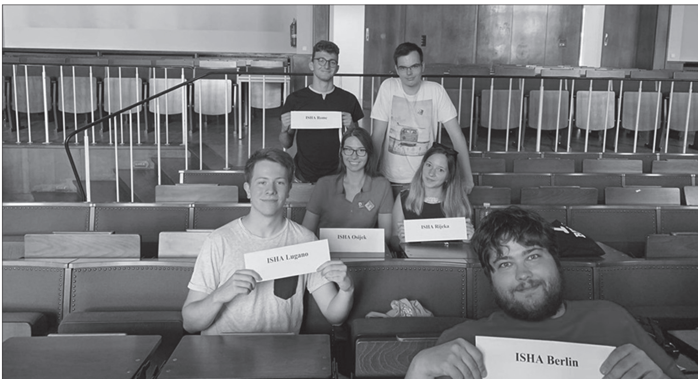
ISHA Osijek i neki od članova drugih ISHA sekcija

večer je bila posvećena „Farewell Partyju“ gdje smo imali posljednju priliku na seminaru popričati s kolegama povjesničarima i složiti prve dojmove o seminaru. Tročlano predstavništvo ISHA-e Osijek sljedeći dan sretno se vratilo kući avionom preko Budimpešte. Sve u svemu, ISHA Berlin su se kao organizatori pokazali iznimno sposobni te su napravili vrlo bogat program, koji je imao pravi balans akademskih i neformalnih aktivnosti. Čestitamo im se na uspješno organiziranom ISHA seminaru, te im zahvaljujemo na stvaranju još jedne prilike za druženje s našim ISHA kolegama.