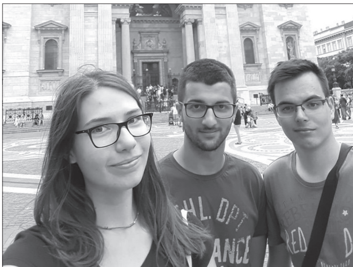
Članovi ISHA-e Osijek na kratkom prolasku kroz Budimpeštu

je i uobičajeno za seminare, predzadnju večer održan je tzv. NFDP (National Food and Drinks Party) na kojem su sudionici seminara ponudili hranu i piće koje su donijeli iz svojih država ili regija.