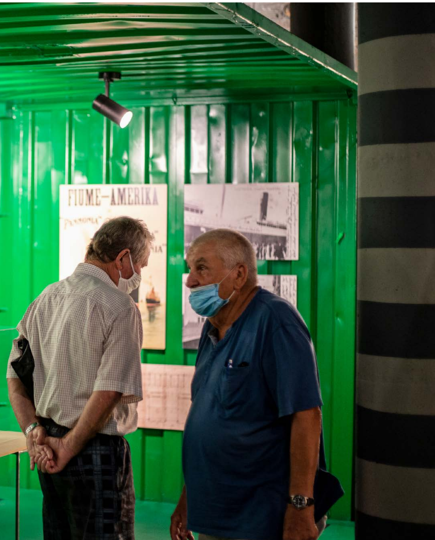
Izložba Fiume Fantastika: Fenomeni grada . ↑