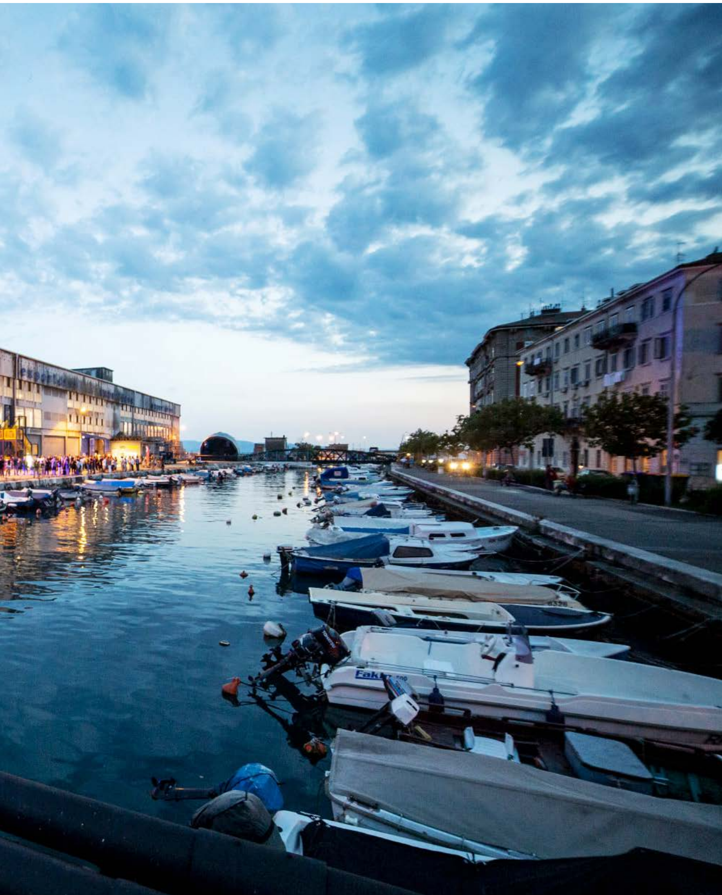
Izložba Fiume Fantastika: Fenomeni grada .