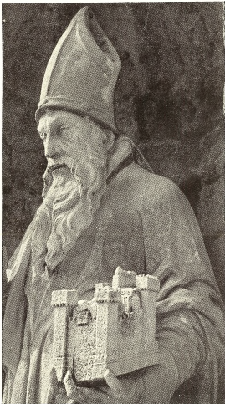
Juraj Dalmatinac, sv. Vlaho, gornji dio