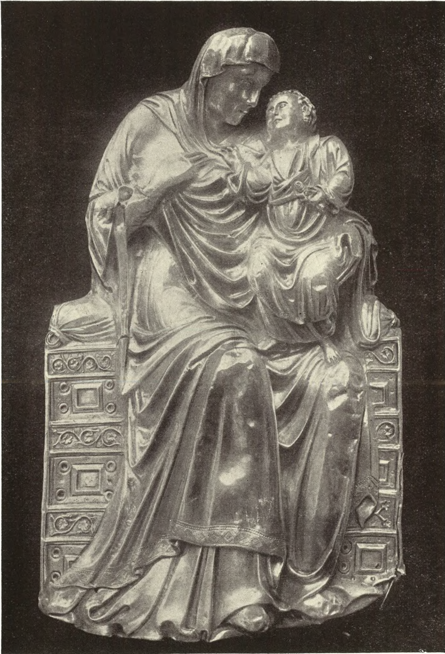
Marija sa sinom sa srebrne pale splitske stolne crkve