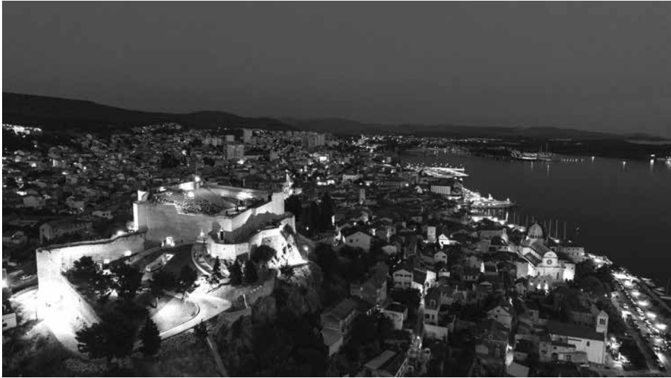
10. Ljetna pozornica na tvrđavi sv. Mihovila, 2017.