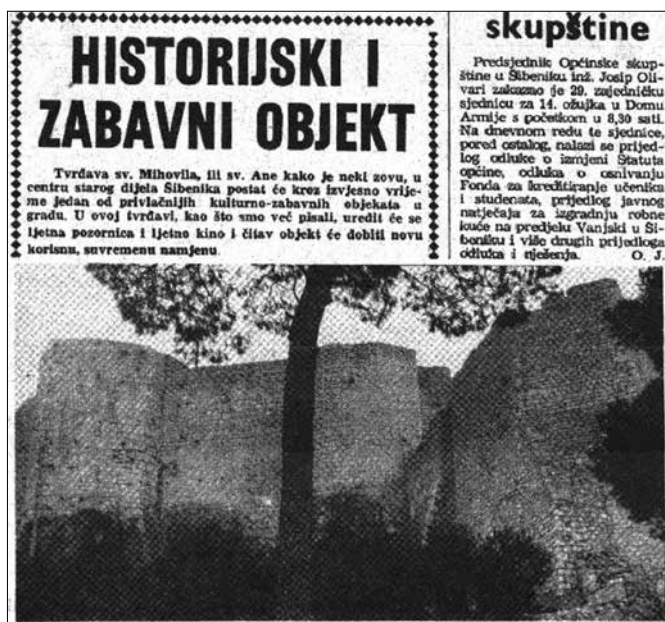
7. Historijski i zabavni objekt, Slobodna Dalmacija, 10. ožujka 1972.