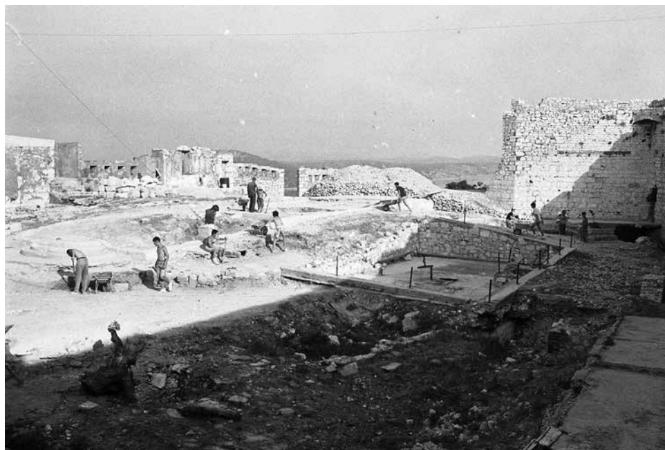
8. Fotografija prvih arheoloških radova na tvrđavi sv. Mihovila, 1972.

se uvijek čeka „mišljenje”, 118 odnosno „odluka arheologa”, 119 a moguće su i „korekcije u pogledu lokaliteta ljetne pozornice”. 120 Konačno je gordijski čvor presječen u travnju 1973. godine kada ljetna pozornica na tvrđavi sv. Ane nije dobila „vizu” Izvršnog odbora Općinske konferencije SSRN. Naime, na toj tvrđavi, kako su pokazala prva istraživanja, značajan je arheološki lokalitet koji najprije treba temeljito ispitati i potom konzervirati kako bi ostao sačuvan. Zbog toga se odustalo od izgradnje ljetne pozornice na Sv. Ani, a investitoru Centru za kulturu predložilo da „traži drugo rješenje”. 121