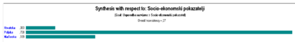
Slika 4. Rezultati vrednovanja socio-ekonomskih pokazatelja

Među zemljama koje se uspoređuju u ovom radu, udio poljoprivrednika sa završenim neformalnim poljoprivrednim obrazovanjem najmanji je u Hrvatskoj (2,4%), slijedi je Mađarska s 4,4% poljoprivrednika, dok je najveći udio poljoprivrednika s neformalnim poljoprivrednim obrazovanjem u Poljskoj (27,4%). Od usporedno analiziranih zemalja, najmanji udio poljoprivrednika s najnižom razinom ima Poljska (15,6%), zatim ju slijedi Mađarska (26,3%), dok je u Hrvatskoj najveći udio poljoprivrednika s najnižom razinom obrazovanja (48%). Najveći udio mladih poljoprivrednika je u Poljskoj (20,30%), Mađarskoj (12,60%), dok je Hrvatska s najmanjim udjelom od tri promatrane zemlje 10,50%.