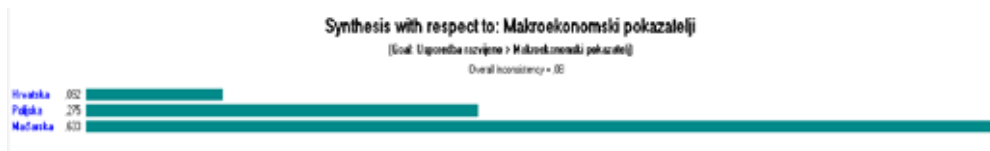
Slika 2. Rezultati vrednovanja makroekonomskih pokazatelja

žom produktivnosti od 7.184,29 €/gospodarstvu. Sukladno izračunima, najmanja pokrivenost uvoza izvozom poljoprivrednih proizvoda je u Hrvatskoj (68,79%), dok su Mađarska (148,41%) i Poljska (151,68%) značajni neto izvoznici. Od usporednih zemalja Poljska je jedina promatrana zemlja koja bilježi rast investicija u poljoprivredi, te isti iznosi 2%, dok Mađarska i Hrvatska bilježe negativne stope rasta investicije od, -0,5% i -8,7%.