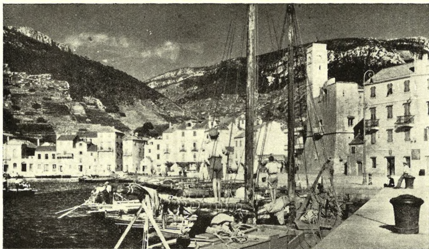
Sl. 1. Komiška luka