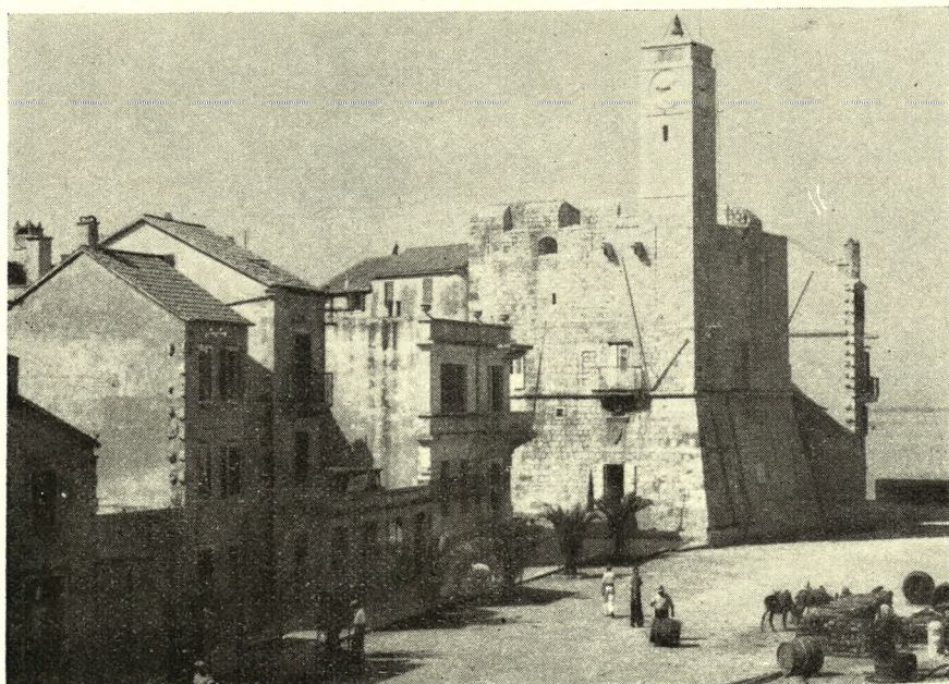
Sl. 2. Tvrđava u Komiži na Visu