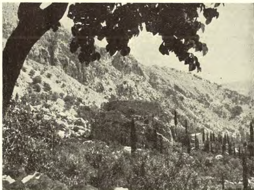
Sredovječni grad Soko

Iako su mnogi delovi srušeni i nepovratno propali, Soko-grad predstavlja značajan fortifikacioni objekt, karakterističan kako za političko stanje na dubrovačkim granicama, tako i za vojnu i odbranbenu tehniku svoga doba.