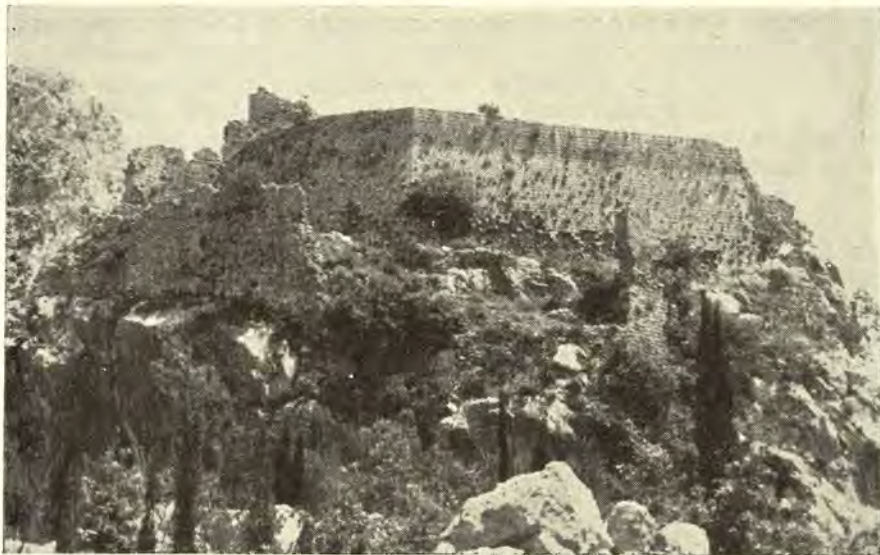
Sredovječni grad Soko. Pogled sa zapada

Iza glavnog ulaza jedna strma, sada dobrim delom zatrpana, staza vodi desno prema platou citadele. Bočni zidovi ovog prolaza su oziđani kamenim kvaderima, te su verovatno ovde postojale nekad stepenice kojima se izlazilo na najviši deo. S druge strane, po sačuvanim delovima svoda, može se pretpostaviti da je ovaj prolaz bio pokriven.