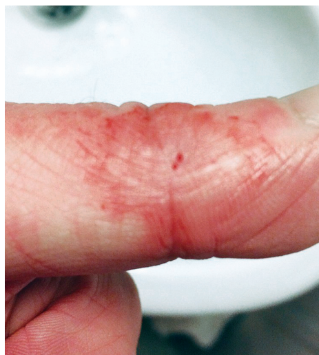
Slika 1. Lokalna reakcija nakon samoinjiciranja cjevica za ribe koje sadržava mineralno ulje [Aas i Rø, 2019.]

Prema monografiji 0062 Europske farmakopeje: Cjevica za primjenu u veterini (engl. Vaccines for veterinary use ) na etiketi cjevica koje sadržava mineralno ulje mora biti navedeno upozorenje da je u slučaju samoinjiciranja nužno potražiti hitnu liječničku pomoć (Anonymous, 2020.a).