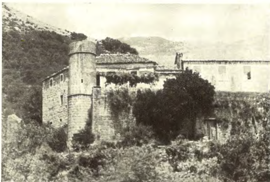
Dio manastira Podostroga

u naizmeničnim redovima crvenog i belog kamena. To je jednobrodna zasvedena građevina, pravougaone osnove, sa polukružnom apsidom prema istoku i pravilnim osmougaonim kubetom (nad glavnim brodom). Ima nekoliko lepih ukrasa u kamenu među kojima se naročito ističu rozeta na ulazu, ornamentisani nadvratnici sa starim crnogorskim grbom (dvooglavi orao sa zmijom) i poneki element unutrašnje arhitekture. 2