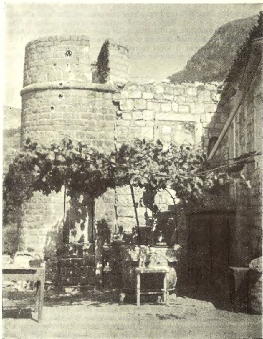
Terasa i kula manastira Podostroga