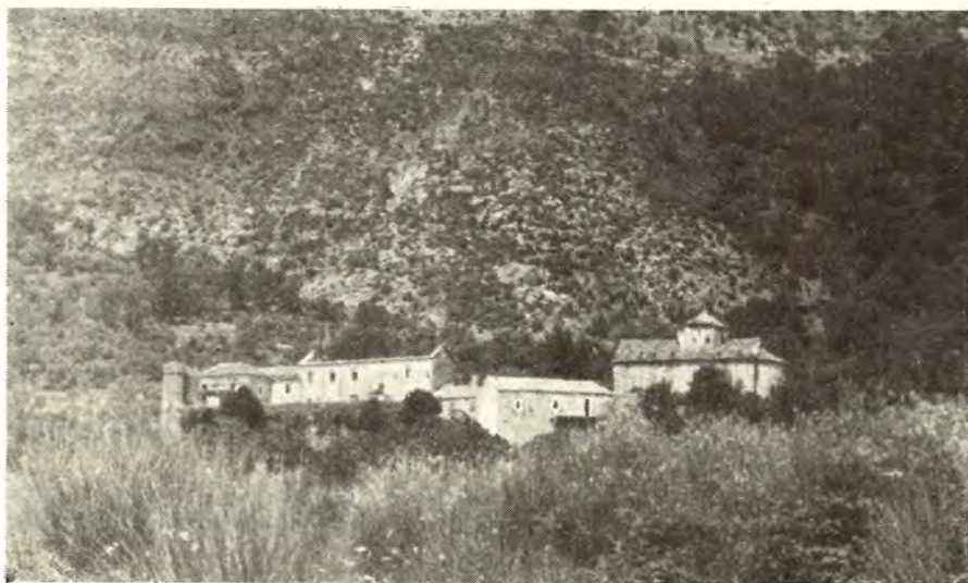
Manastir Podostrog u Mainama

Građevina, svojim izduženim oblikom u pravcu istok-zapad, zauzima približno sredinu imanja koje je nekada bilo obrađivano i zasađeno pored ostalog i vinovom lozom, a sada je zapušteno. Osnova je nepravilna i razučena usled naknadnih dograđivanja.