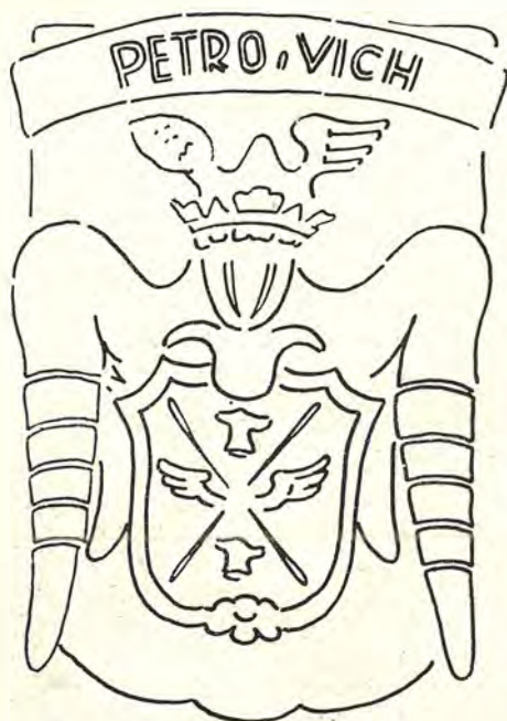
Grb Petrovića u Podostrogu

Druga prostorija, u kojoj se nalazi crkva, nešto je veća po prostanstvu od opisane pristupne odaje i iznosi približno 3 × 4,5 metra.